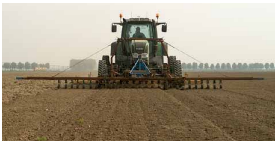
Biologische akkerbouwers hebben veel aan de RTK-GPS techniek

Eindredactie / Vormgeving / Productie Wageningen UR, Communication Services e-mail: h.vankeulen@wur.nl telefoon: 0317 486 370