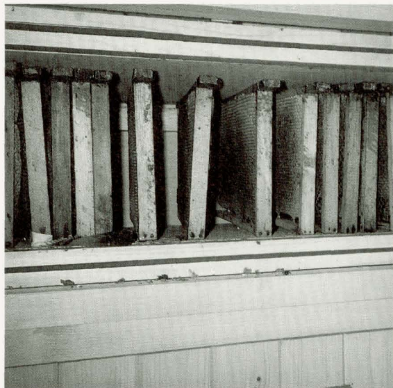
De insteekkast van dichtbij bekeken

De bijenstal van de VBBN subvereniging Enschede beschikt over een ramenkast met een praktisch insteekstelsel. Een oortje wordt tussen het dak en een latje achter in de kast gestoken (zie tekening). Vóór rust het raam op een lat op de bodem van de