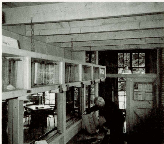
De Enschedese bijenstal

De bijenstal van de VBBN subvereniging Enschede beschikt over een ramenkast met een praktisch insteekstelsel. Een oortje wordt tussen het dak en een latje achter in de kast gestoken (zie tekening). Vóór rust het raam op een lat op de bodem van de