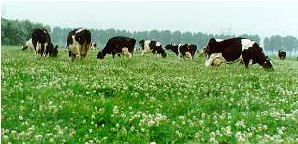
Witte klaver in grasland kan veel stikstof leveren als voedingsbron voor de grasgroei

In het voorjaar is de beschikbaarheid van stikstof voor grasland met klaver nog maar gering omdat door de lage temperaturen de stikstofbinding en mineralisatie nog op gang moet komen. Aanwending van een gift drijfmest of stalmest kan dan voor stikstof zorgen voor een betere voorjaarsgroei.