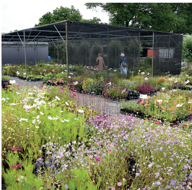
In dit deel zijn vaste planten te vinden die geschikt zijn voor schaduwtuinen.