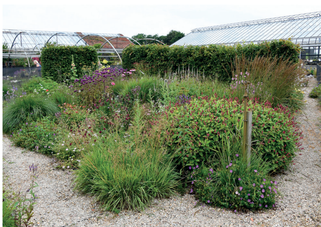
De inspiratietuin is aangelegd om bezoekers te laten zien hoe vaste planten, eenjarigen en bloembollen zich ontwikkelen, zodat kopers kunnen zien wat het uiteindelijke resultaat wordt.

voor de schaduw. “Daar krijgen we vaak vragen over. Welke planten kunnen we in de schaduw zetten? In een schaduwhal hebben we daar een flink sortiment voor samengesteld.” De droogte van vorige zomer inspireerde de kwekers om het sortiment nog eens door te nemen op dat aspect. Het leverde een mooie en gevarieerde verzameling planten op. En dan is er nog de vraag naar bijenplanten. “Eigenlijk een beetje overbodige vraag, want de meeste planten die in de zomer bloeien, zijn aantrekkelijk voor bijen.”