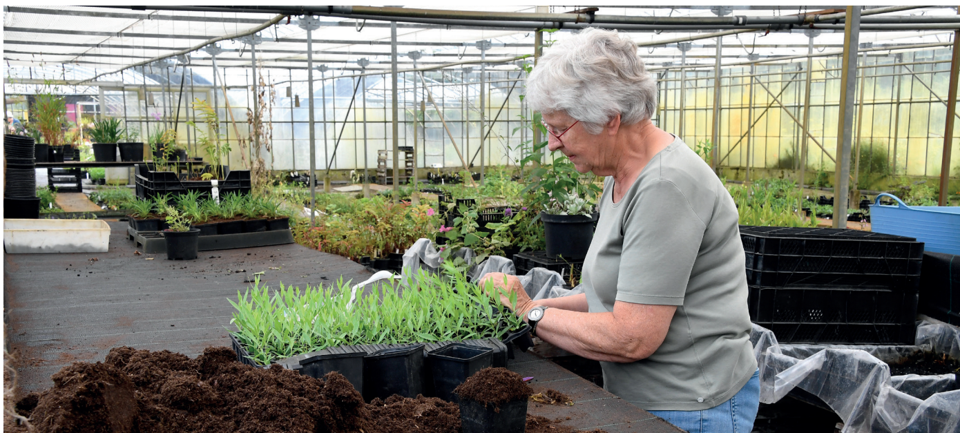
In de opkweekkas worden nu alweer stekken gemaakt voor volgend jaar.