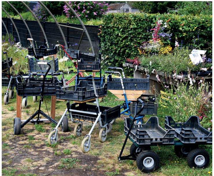
Rollators doen dienst als handig voertuig om aangekochte planten te verzamelen.

Bijzonder betekent voor Festina Lente ook dat planten langdurig bloeien. Daarnaast zijn relatief veel planten geschikt