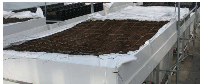
Systeem 3, veenbed