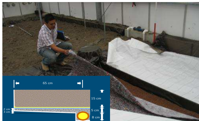
Systeem 2, zandbed