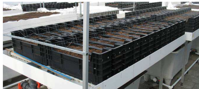
Systeem 4, versmalde leliekisten