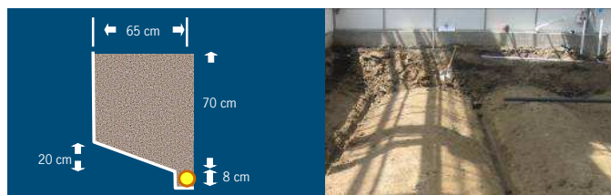
Systeem 1, diep grondbed

Systeem 3-5 krijgen water via het eb en vloed systeem van de tafels.