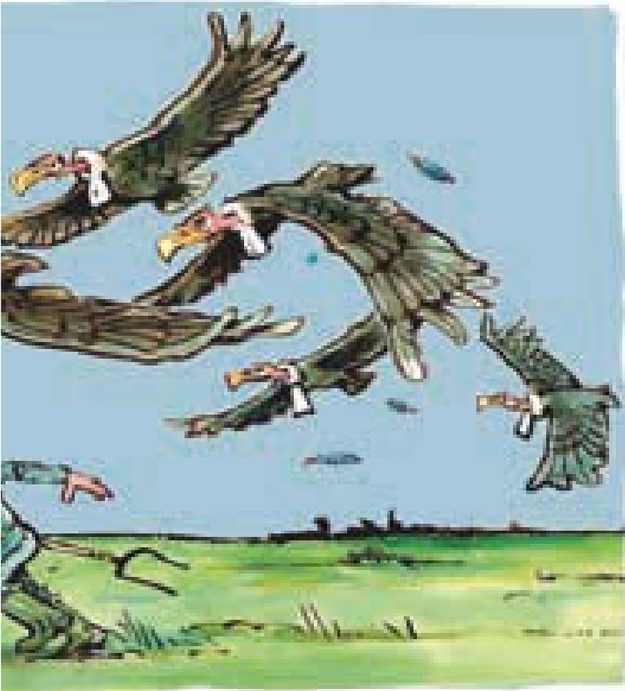
TEKENING: HENK VAN RUITENBEEK