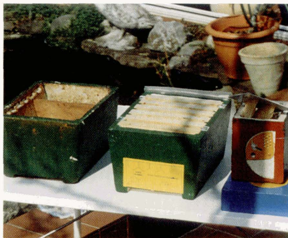
Het Kielerkastje links zonder ramen en met voerbak; rechts met raampjes. Daarnaast het zgn. Cellerkastje.

Dit kastje is een afgeleide van het Cellerkastje dat in groter formaat en in hout is uitgevoerd. Het is gemaakt van kunststof en een stuk kleiner dan zijn voorganger (zie foto). Het is wat capaciteit aan bijen