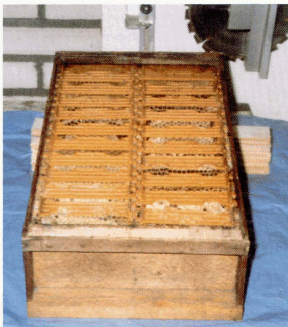
Opzetbakje voor 6-ramer.

Wie veel en vaak gebruik maakt van apideakastjes tot in de nazomer toe, ziet zich voor de vraag gesteld: waar laat ik al die belegde en bebroede raampjes incl. bijen? De moederloze bijen laten zich gemakkelijk verenigen in b.v. een 6-ramer. Daarop zetten we een zelfgemaakte bak/rand (zie foto) waarin op een glijstripje de raampjes met open en gesloten broed komen te hangen. Uiteraard moet dit volkje een koningin hebben om vanaf nu b.v. ingewinterd te worden.