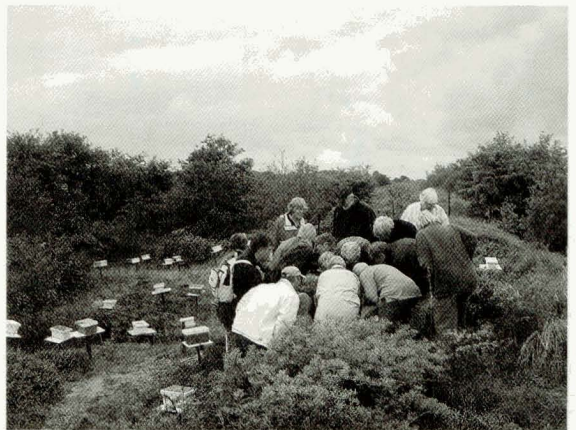
VBBN subvereniging 'De Wijk e.O.' heeft in augustus 2004 een reisje gemaakt naar Schiermonnikoog en bracht een bezoek aan het carnicateeltstation aldaar. Met z'n allen tegelijk en zeer aandachtig luisteren en kijken naar het werk van de heer Harm Veenhuis, die iedereen met een prachtig verhaal aan zich wist te kluisteren.

Op het teeltstation zijn er 450 stuks van aanwezig. Afhankelijk van de aangevraagde moeren kunnen alle kastjes in gebruik worden genomen. Bij een gebruik van 300 à 350 bijen per bevruchtungskastje worden er dan ongeveer 160.000 bijen van de volken op de stand afgetapt. Een behoorlijke aanslag op de ongeveer 30 à 35 aanwezige volken. Nadat de moeren na voorafgaande selectie zijn geogst en afgeleverd worden de moerlose volkjes in een verhouding van één op drie samengevoegd. Daartoe worden de raatjes met broed en voer in de overblijvende kastjes geconcentreerd tot zes raatjes per kastje (twee extra in de voerruimte na verwijdering schotje). Van de bijen