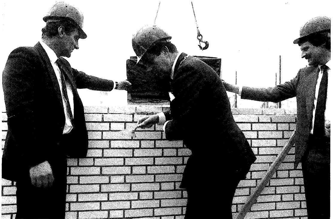
De eerste steenlegging

Geschiedenis van het Proefstation tot nu toe Op 15 september 1982 vond de bijeenkomst plaats, die de eerste aanzet heeft gegeven tot de totstandkoming van het Proefstation voor de Varkenshouderij. Bij deze gelegenheid is gesproken over de oprichting van een Stuurgroep "Proefstation voor de Varkenshouderij in oprichting". Op 25 oktober 1982 vond de eerste vergadering van deze stuurgroep plaats. In deze stuurgroep zaten vertegenwoordigers van het Ministerie van Landbouw en Visserij, het Produktschap voor Vee en Vlees, het Landbouwschap en de regionale Varkensproefbedrijven. In maart 1983 presenteerde de Stuurgroep het rapport "Proefstation Varkenshouderij in oprichting". In november 1983 werd de plaats bekend waar het Proefstation zou worden gevestigd: in Rosmalen, aan de Lunerkampweg. Op 20 september 1984 is de notariële akte tot oprichting van de Stichting Proefstation voor de Varkenshouderij gepasseerd en op 4 oktober 1984 volgde de benoeming van de