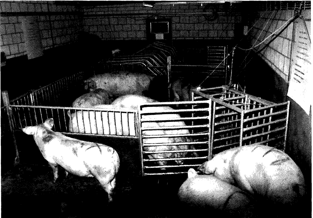
Experimentele loopstal-opstelling op het Proefstation voor de Varkenshouderij in Rosmalen

De ervaringen van de afgelopen periode geven aan, dat er goede en voor verbetering vatbare kanten aan het loopstalsysteem zijn. Het systeem zal verder aangepast worden. Hierbij zal ook gebruik gemaakt worden van buitenlandse ervaringen. ■