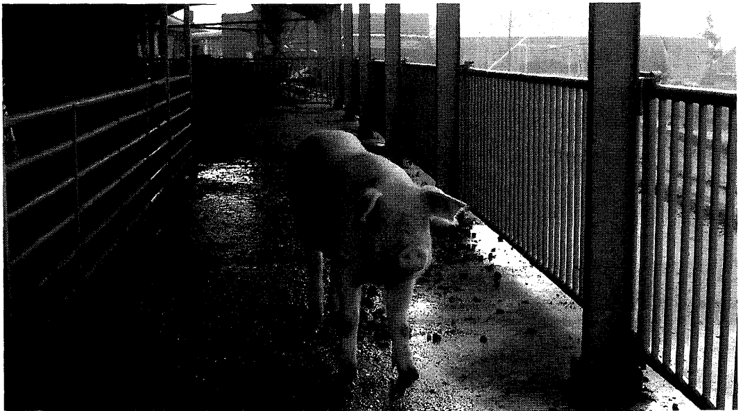
Uitloop voor geste- en dragende zeugen

De scharrelvleesvarkens worden gehuisvest in vier afdelingen, die elk een uitloop naar buiten hebben. In twee afdelingen komen een drietal hokken die ruimte bieden voor respectievelijk 8, 16 en 24 vleesvarkens. De andere twee afdelingen hebben hokken voor elk 10 vleesvarkens. Het onderzoek dat zal starten in 1992, zal zich ook hier richten op het optimaliseren van de scharrelvleesvarkenshouderij. Er zal onderzoek gedaan worden naar verschillende groepsgroottes, de arbeid, de bevuiling (uitmesten, stroverstrekking), het ruwvoer en de uitloop. ■