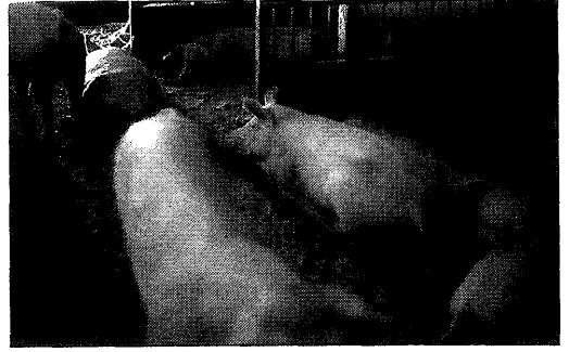
Groepshuisvesting drachtige zeugen

gens de ISC-normen. Deze bronststimulatie zal moeten plaatsvinden door gebruik te maken van natuurlijke hulpmiddelen. De zeugen met biggen zullen na 3,5 week zogen, naar een andere afdeling worden verplaatst. Er zullen daar kleine groepjes worden geformeerd en er zal beercontact zijn. Aan de uitval van de biggen wordt ook speciaal aandacht besteed. Verder zal er onderzoek verricht worden naar de arbeidsbehoefte, de hokbevuiling (uitmesten, stro-verstrekking), het ruwvoer en de uitloop.