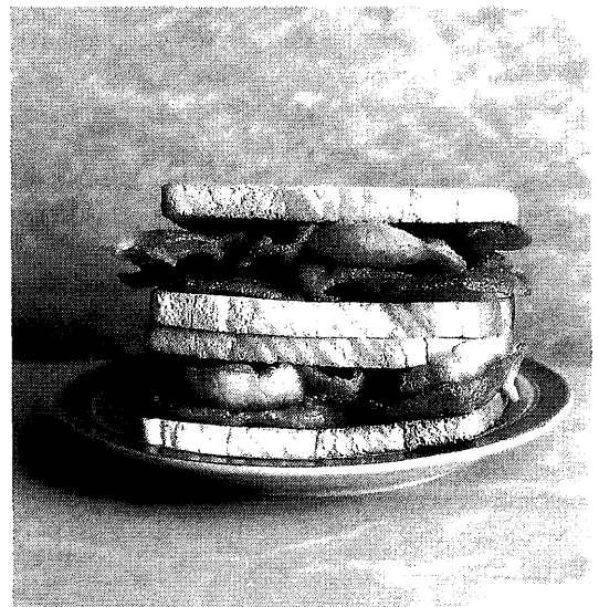
Gebakken bacon, een succesproduct in het Verenigd Koninkrijk