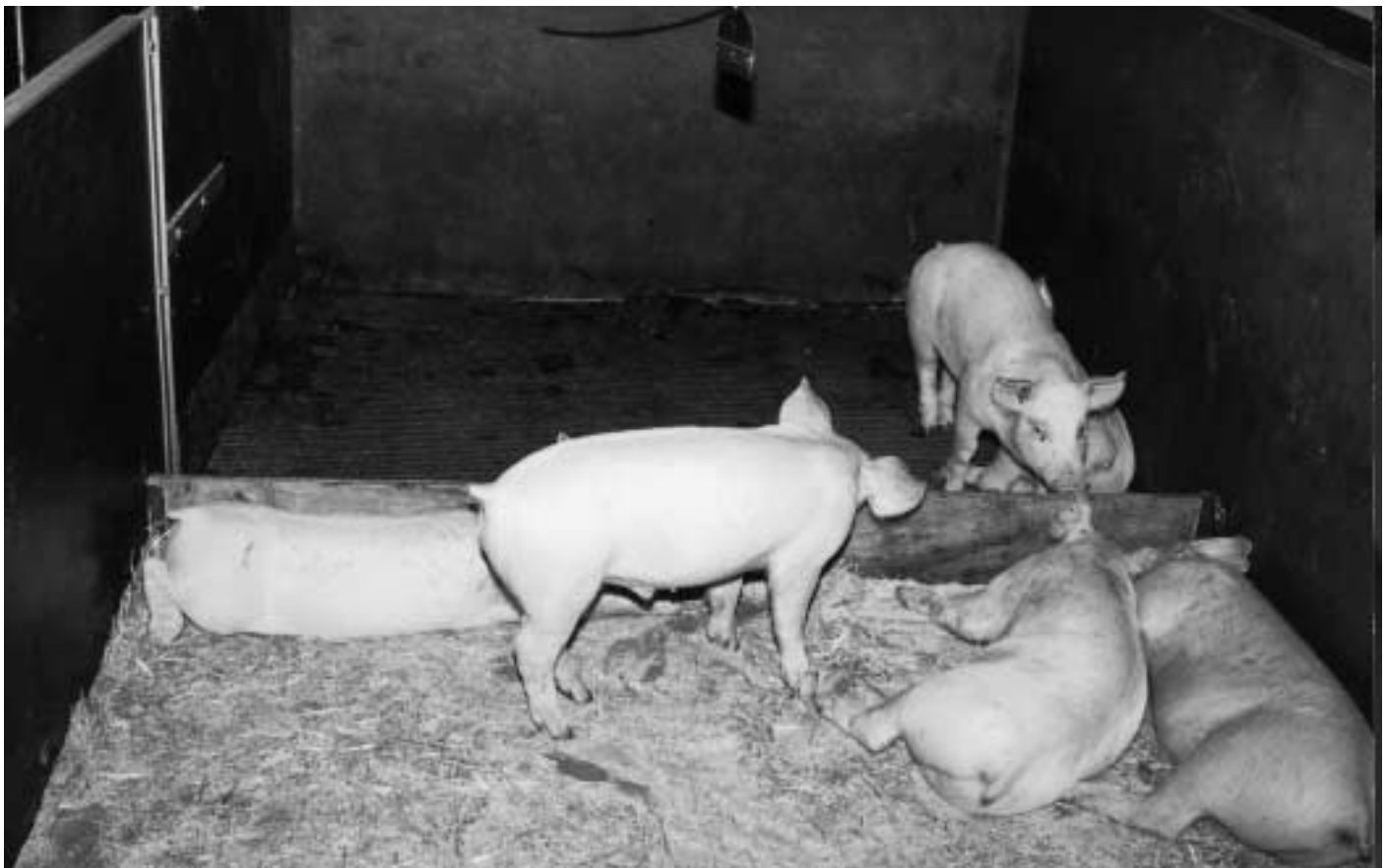
Vleesvarkens in aangepaste hokken met stro

Het gebruik van stro in een aangepast gangbaar vleesvarkenshok geeft meer hokbevuiling. De plaatsing van de voerbak voor in het hok vermindert het probleem ten opzichte van hokken met de voerbak achterin: het creëren van een rustgebied tussen vreetplaats en mestplaats heeft dus voordelen. Daarentegen heeft de locatie van het afleidingsmateriaal geen effect op de hokbevuiling in dit type hokken.