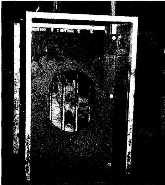
Foto: Het meldpoortje van de berigheidsdetectie.

worden. Daarbij wordt uitgegaan van het bekende gegeven, dat berige zeugen het gezelschap van een beer opzoeken als deze in de afdeling is. De firma Hokofarm heeft onlangs de automatische berigheidsregistratie in haar pakket opgenomen.