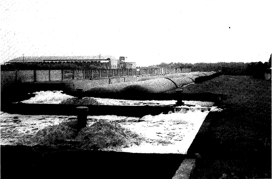
Zuiveringsinstallatie voor mestwater in Taiwan

Hiertoe wordt momenteel een proefplan opgesteld. Zodra over de voortgang van dit onderzoek meer te vermelden valt zullen wij daarop terugkomen in dit blad.