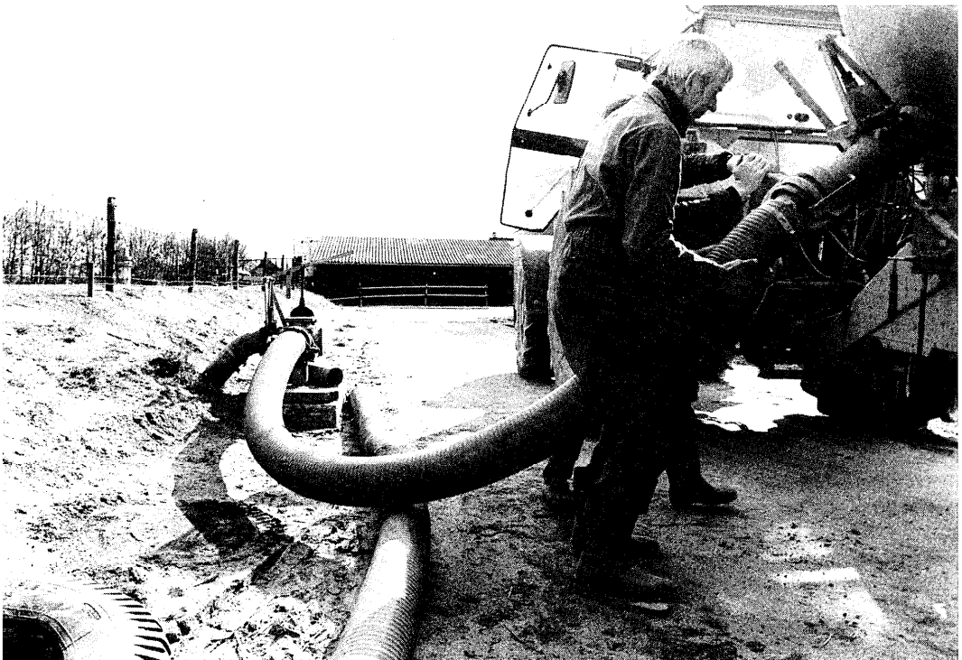
Transport en vullen van de tank neemt een groot gedeelte van dewerktijd in beslag.