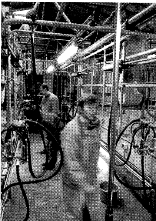
Onderzoek van reiniging is volop in beweging.

De melkwinningfabrikant die destijds de stal had ingericht, werd gevraagd deze stal in te richten tot een experimentele reinigingsstal. Uitgangspunt was dat zoveel mogelijk in glas werd uitgevoerd om de stroming van water en lucht te kunnen zien.