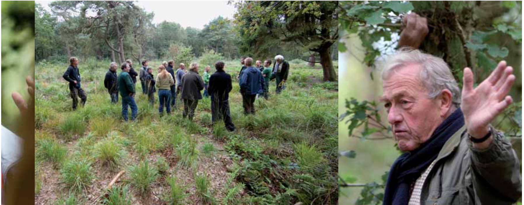
De excursiegangers van de Veldwerkplaats Eikenhakhout luisteren naar de verhalen uit de weerbarstige praktijk.

wel, hoe zal dit zich ontwikkelen. Wie het weet mag het zeggen, maar echte antwoorden hebben ook de excursiegangers niet. Ook particulier Gelder heeft het geprobeerd. Al bijna dertig jaar geleden heeft hij op rabatten een stuk gekapt en enkele eiken laten staan. Hij is teleurgesteld over het resultaat. Naast de overgebleven eikenbomen is het een dicht woud van lijsterbes, zonder verdere noemenswaardige ondergroei. Veel te veel eiken laten staan inder tijd, is de meest gehoorde opmerking hier. Eikenhakhout heeft echt genoeg licht nodig, anders schieten de stobben niet uit. Maar ja, en dat snappen de meesten ook wel, het is moeilijk om echt heel rigoureuus te kappen. Gelukkig heeft Gelder vorig jaar nog een perceel afgezet. Hij blijft het proberen. En ja, hier is genoeg licht, en iedereen kan het zien, de eikenstobben groeien uit. Het vogelkersprobleem is wat Gelder betreft hier afdoende opgelost. Hij gaat regelmatig alle opslag na met Roundup, de enige methode. En zolang ook de excursiegangers geen betere oplossing hebben, zal hij er mee door gaan. Blijft nog een enkel probleem over: de reeën. Want die zien die verse eikentwijgen wel zitten. Alle mogelijke oplossingen passeren onmiddel-