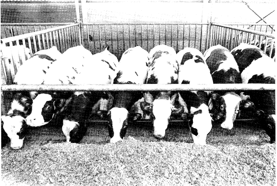
Voor de stierenmester is het van groot belang op de kwaliteit van het uitgangsmateriaal te letten

Omdat het rendement in de sector nu al matig is wordt verwacht dat veel stierenmesters niet opgewassen zullen zijn tegen deze aanzienlijke aantasting van hun inkomen. Zij zullen de vleesstierentak geheel of gedeeltelijk vaarwel moeten zeggen om binnen de gestelde normen te blijven. Het te verwachten milieubeleid versterkt bovengaande bedreiging voor de Nederlandse vleesstierenhouderij. Een aanscherping van de fosfaatgebruiksnormen betekent namelijk dat men bij de huidige veebezetting een groot deel van de mest tegen hoge kosten moet afvoeren.