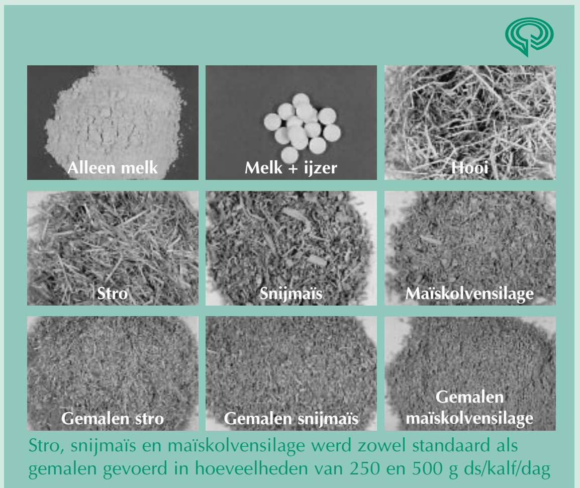
Figuur 1 De ruwvoerbehandelingen in de proef

ruwvoer bijdragen aan minder stereotypisch gedrag zoals tongspelen en bijten of zuigen aan de trog en meer herkauwactiviteit. Daarnaast moet de pensontwikkeling worden gestimuleerd. De grote vraag is welke typen ruwvoer of beter gezegd welke aspecten van ruwvoer hiertoe bijdragen en wat de invloed is op de technische resultaten en de kwaliteit van het eindproduct, vooral de vleeskwaliteit.