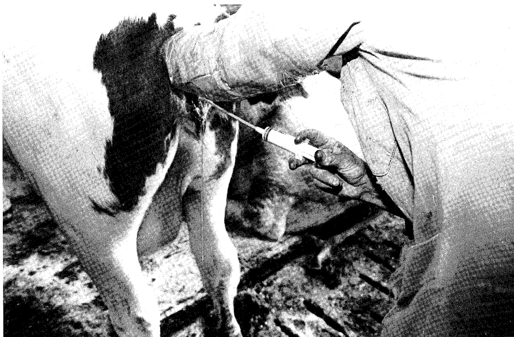
Het uiteindelijke drachtigheidspercentage varieert van 80 tot meer dan 90%.

Het percentage dieren aangeboden voor vrucht-