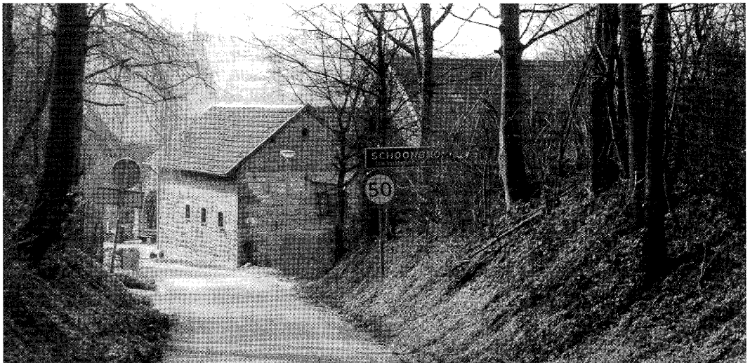
Net binnen de bebouwde kom van Schoonbron ligt MDM-bedrijf Huntjens.