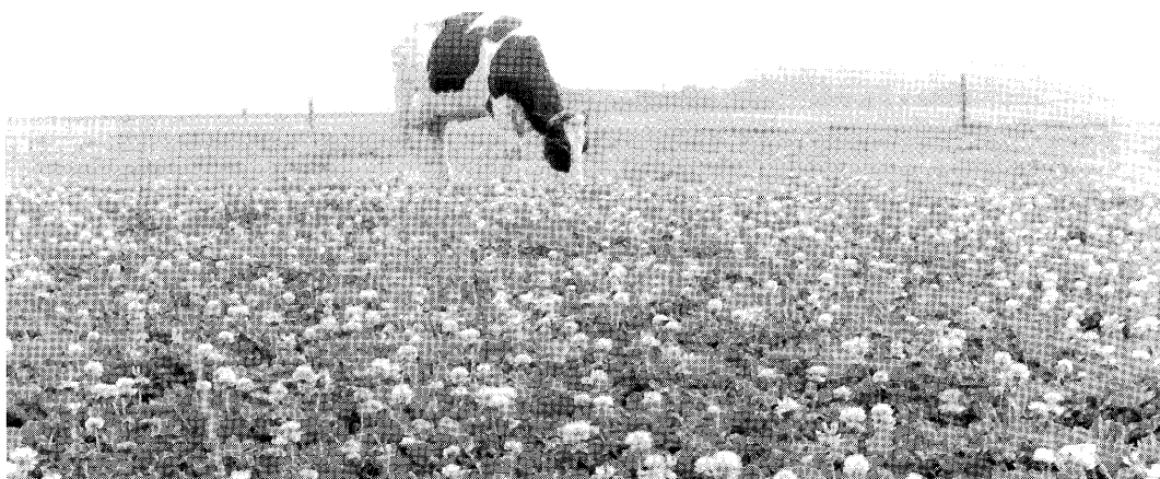
Bij een flink aandeel witte klaver in het bestand kan een goede zomerproductie worden verkregen.

Indien de opbrengsten wat meer in detail bestu-