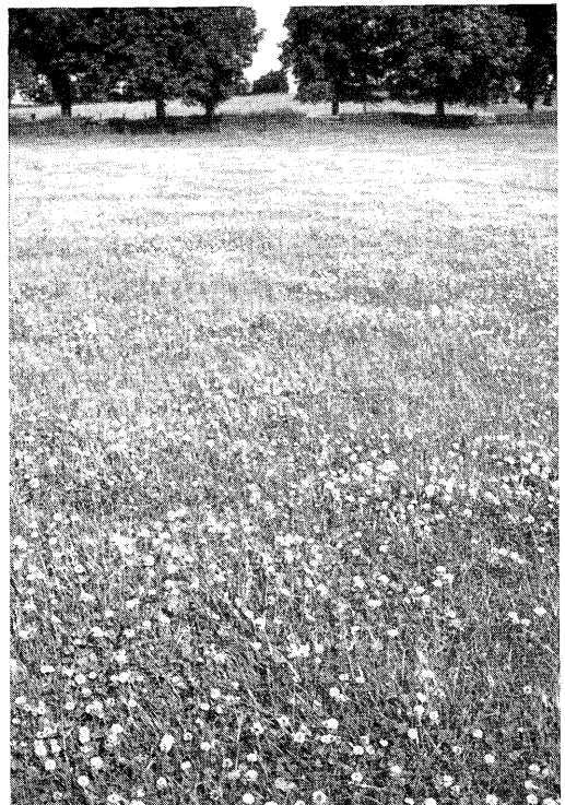
Gras/klaver mengsel op de Crichton Royal Farm.

Het beweidingsonderzoek in Groot-Brittannië richt zich met name op het standweiden. Dit wordt als een eenvoudig en goed werkend systeem gezien. Omdat de bedrijven vrijwel geheel afhankelijk zijn van de eigen ruwvoerproductie wordt veel aandacht besteed aan de productie per ha in kilogrammen vlees en/of melk. Naar aanleiding van de bezoeken is de algemene indruk dat het hand-