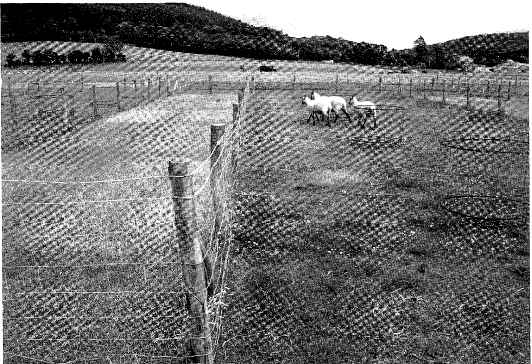
Testen van gras/klavermengsels bij maaien en beweiden met schapen (WPBS).

Bij de instellingen NWRS en WPBS werden veel metingen verricht naar de diverse verliesposten van stikstof onder verschillende systemen. Bij het NWRS werd geen verschil geconstateerd in nitraatuitspoeling tussen een 0 N gras/klaversisteem en een 0 N grassysteem. Beide systemen werden beweid door vleesvee. Bij het WPBS werd echter geconstateerd dat bij het beweiden met schapen de nitraatuitspoeling bij een 0 N gras/klaversisteem hoger was dan bij een 200 N grassysteem. Ter nuancering moet vermeld worden dat het absolute niveau van uitspoeling vrij laag was en ruim onder de drinkwaternorm lag. Bij het MLURI wordt zeer fundamenteel onderzoek verricht naar de diverse deelprocessen in de nutriëntenkringloop zoals stikstoftransport van door vee opgenomen gras naar de bodem, transport van door klaver gefixeerde stikstof naar gras en het effect van beweiding en kunstmeststikstof op de stikstoffixatie. In een proef waarbij schapenurine op een gras/klavermengsel werd toegediend bleek dat de groei van klaver meteen afnam en dat bovengrondse uitlopers afstierven. Dit effect was tot 17 weken na toediening nog meetbaar.