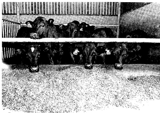
Vleesstieren op De Vlierd.

Bij de voeding van vleesstieren wordt steeds meer gebruik gemaakt van industriële bijproducten. Eerder onderzoek heeft aangetoond dat het voeren van grote hoeveelheden van deze (vrijwel) structuurloze producten goede perspectieven biedt. Bij dit onderzoek was aanvullend een standaardgift stierenbrok verstrekt, terwijl bij een optimaal rantsoen de eiwitgift eigenlijk moet worden aangepast naarmate er meer bijproduct gevoerd wordt. Op De Vlierd wordt nu de geschiktheid als voer van aardappelzetmeel onderzocht alsmede de minimale snijmaisbehoefte om in de structuurvoorziening te voldoen. Tevens wordt gekeken naar de verschillen tussen gemengd en