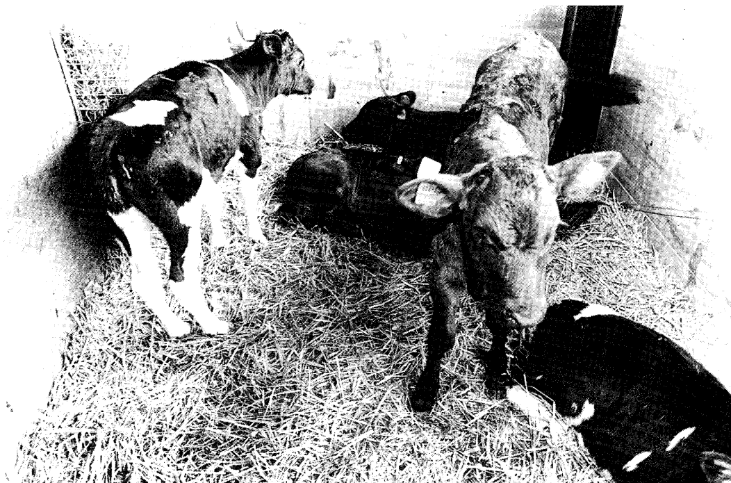
Insemineren van een vleesrasstier levert een gekleurd kalverhok op!

Berekeningen zijn uitgevoerd voor verschillende bedrijfsplannen. Een bedrijfsplan wordt bepaald door het melkquotum per hectare, de melkproduktie per koe, de stikstofbemesting per hectare