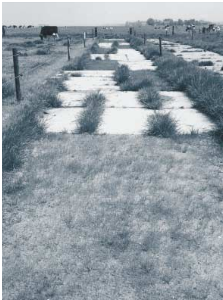
Kunststofgrasplaten (voorgond) in aanleg

Voor de aanleg is het gras eerst oppervlakkig gefreesd. De gefreesde laag is daarna weggeschraapt om de betonplaten aan te leggen. Op de plek waar de grasplaten moesten komen is de laag gedeeltelijk blijven liggen. Tijdens de aanleg is een beperkte hoeveelheid schoon zand gebruikt voor de vlaklegging van de platen. De platen zijn een paar dagen later ingezaaid. In de daarop volgende weken is het gras een aantal malen gemaaid met een weidebloter om de uitstoeing te bevorderen.