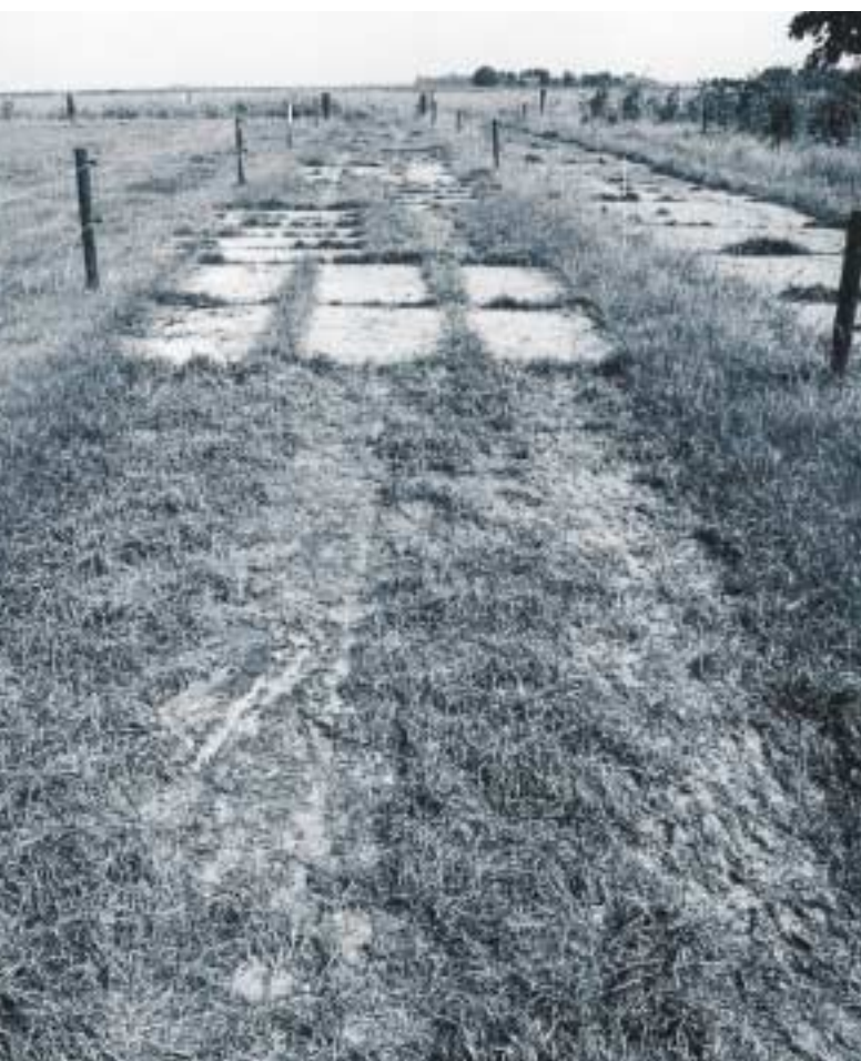
Het koepad van kunststofgrasplaten is een goedkoop alternatief voor de traditionele verharding

Vanaf 8 september zijn de koeien dagelijks over het kavelpad gelopen. Er deden zich geen problemen voor. Op 17 september zijn voor het eerst waarnemingen gedaan. Het bleek dat het gras op de looppaden al behoorlijk weggesleten was. Doordat de platen na het leggen ruim ingestrooid waren en het kleilaagje op de platen nat was door regen, had een aantal koeien moeite met lopen. Het oppervlak was glad. Het aantal dieren dat een bepaald vak passeerde werd op verschillende momenten geteld. Voor beide richtingen was de opzet hetzelfde.