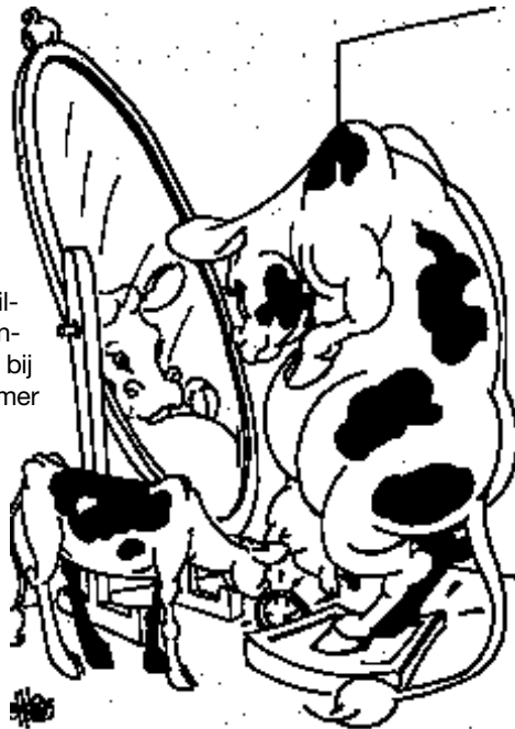
Het gewicht van een melkkoe varieert sterk in de tijd

het verbruik van energie overtreft, stijgt het gewicht weer. Bij jongere dieren treedt dit vrij snel op terwijl bij derdekalfs- en oudere dieren het tot ongeveer 200 dagen na het kalven duurt voordat het gewicht direct na kalven weer bereikt is. Tot