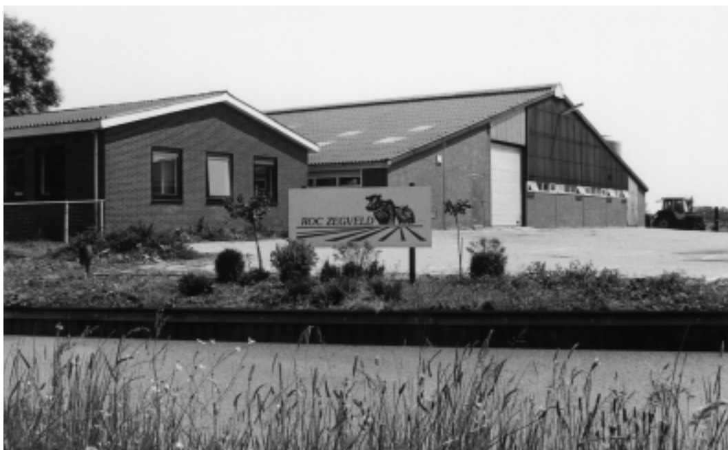
Op ROC Zegveld is onderzoek gedaan naar slootonderhoud en beheer van perceelsranden.

Omdat afvalwater niet meer geloosd mag worden en omdat er op veel bedrijven geen riolering is worden er veel vragen gesteld over de verwerking van afvalwater op het bedrijf. Er is veel onderzoek gedaan naar het hergebruik van water