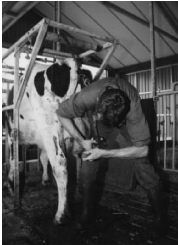
Tijdens de lactatie worden de koeien tweemaal bekapt, en voor droogzetten nog éénmaal.

De JOZ-tech, onze zelfrijdende mestschuifrobot, is nog niet helemaal af. Inmiddels is het exemplaar dat bij de Open Dagen 1998 in de stal aanwezig was, vervangen door het apparaat dat op de Landbouw RAI te zien was. Deze is wat lager dan zijn voorganger (55 cm in plaats van 80 cm). Het apparaat wordt door de koeien goed verdragen. Sommige dieren spelen er zelfs mee of likken hem af. Om te voorkomen dat de dieren aan het oplaadstation komen, als de schuif rondrijdt, is deze in een apart hokje geplaatst. Zo kunnen de dieren ook niet aan de