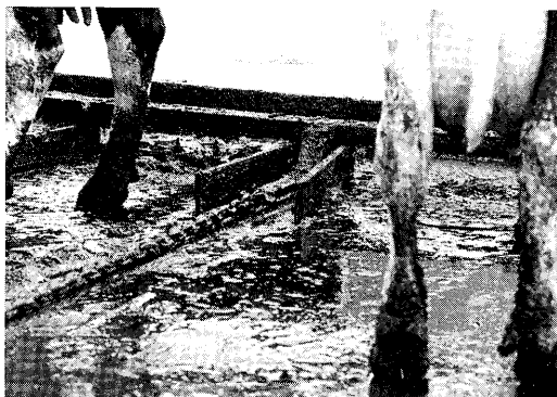
Oude situatie met ammoniakemissie proberen te voorkomen.

300 N. De opbrengst ligt dan per ha 30 % lager. Als de oppervlakte beschikbaar is, kan ondanks een verminderde produktiviteit door een verminderde N-bemesting en met introductie van klaver, een goede kwaliteit ruwvoeder geogost worden. Een zeer belangrijke vraag is of de melkproductie op een hoog niveau kan blijven in vergelijking met alleen gras.