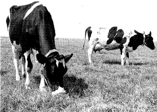
Zelfvoorzienende melkveebedrijven met alleen grasland.

Naast onderzoek gericht op andere nuttige aanwending van het ruwvoer dan voor melkproduktie, is het erg zinnig ook te onderzoeken wat de uitwerking is om met een verlaagde stikstofbemesting het ruwvoerverschot te voorkomen. Dit zo-