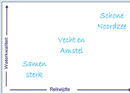
Afbeelding: Het Dagelijks Bestuur na een discussie met het Algemeen Bestuur over gewenste ambities tijdens het werkbezoek aan Berlijn op 12 mei 2017 (links), drie ambitieniveaus (rechts)