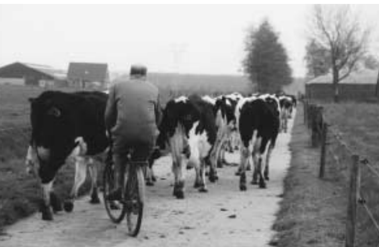
Het Lagekostenbedrijf fietst zeker niet achter de feiten aan, integendeel.

Het lagekostenbedrijf laat zien hoe door kostprijsbesparing meer financieringsruimte overblijft dan bij vergelijkbare bedrijven. Het lagekostenbedrijf biedt ook wat dat betreft ruimte voor de toekomst! 🏠