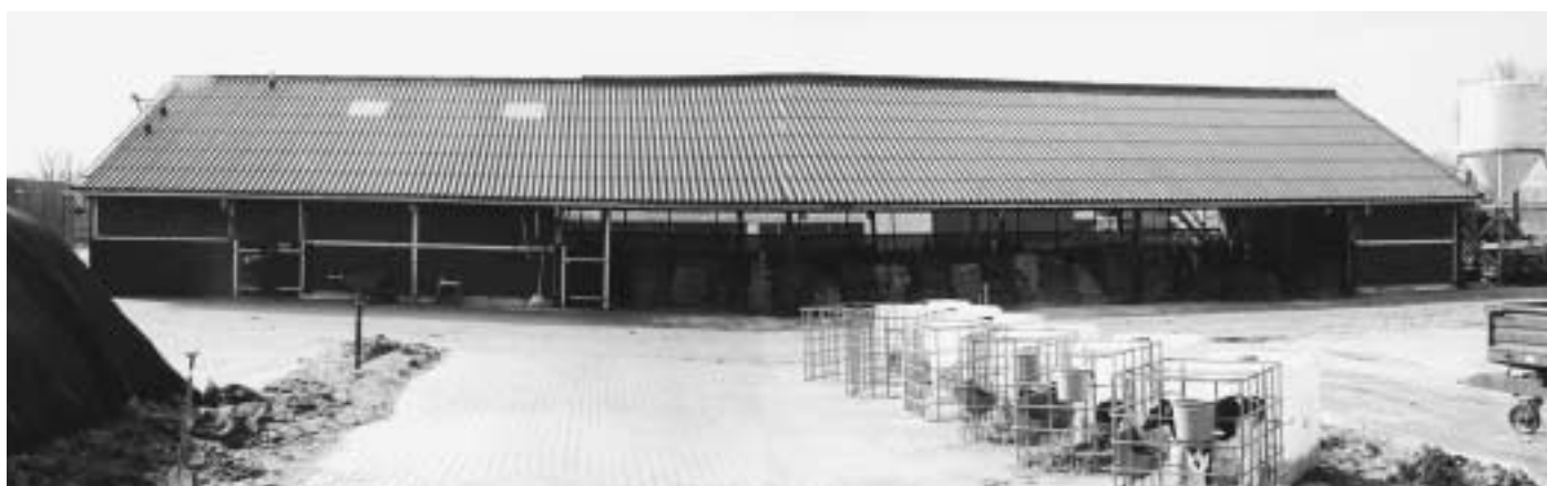
Het lagekostenbedrijf heeft positieve besparingen uit eigen bedrijfsvoering.

Door bij de arbeidsopbrengst de niet uitbetaalde vergoeding voor eigen vermogen op te tellen, is het ondernemersinkomen te berekenen. De niet uitbetaalde vergoeding voor het eigen vermogen gaat vooral om correctie voor kosten die geen uitgaven zijn. Bij het ondernemersinkomen zitten normaal ook de incidentele bedrijfsinkomsten in. Dit kunnen onder andere subsidies, rente rekening-courant en schade-uitkeringen zijn. Omdat we in dit artikel alleen kijken naar structurele posten die direct met de bedrijfsvoering te maken hebben, zijn de incidentele bedrijfsinkomsten buiten beschouwing gelaten. Bij de bepaling van betaalde rente van het lagekostenbedrijf is een inschatting gemaakt van de behoefte aan vreemd vermogen. De basis hiervoor is het geïnvesteerd vermogen. Dit is een stuk lager dan bij de vergelijkingsgroep. Zo is berekend dat het lagekostenbedrijf circa 30% minder rente en aflossing betaalt. Opgemerkt moet worden dat het lagekostenbedrijf niet in grond investeert, iets dat in de vergelijkingsgroep wel gebeurt. Zou