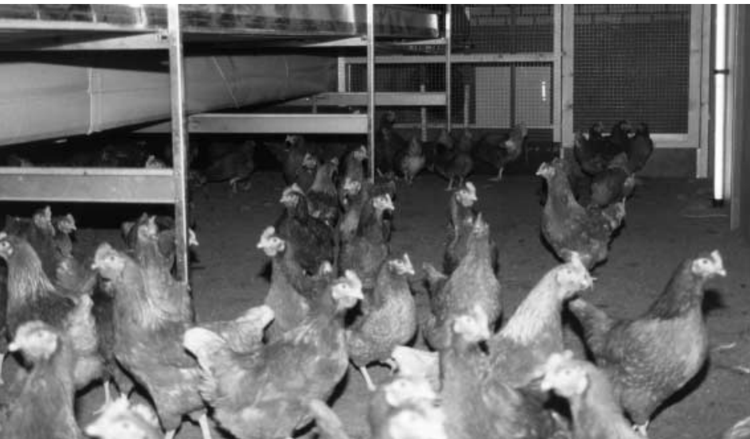
Ondanks het droge strooisel weinig buitennesteieren.

De legperiode van de leghennen in de volièresystemen is halverwege. Tot nu toe produceert het koppel goed maar heeft in het begin van de legperiode wat teveel buitennesteieren gelegd. Door aanpassingen aan het verlichtingsschema is op dit moment het percentage bne's teruggedrongen tot onder de 1 %. Vooral het verlengen van de lichtperiode en het toepassen van een schemerperiode voordat het licht aangaat blijkt goed te werken. Het toepassen van een milde snavelbehandeling op jonge leeftijd geeft de nodige problemen met verenpikkerij en kannibalisme. Om de grootste schade te voorkomen is de lichtsterkte in stappen teruggebracht naar 5 lux op dierhoogte op vloerniveau. Dit had geen gevolgen voor het percentage bne's. Wel is de pikkerij nu beter onder controle en lijken de grootste problemen voorbij. De dieren zijn echter behoorlijk kaal. Dit zal een negatief effect hebben op voeropname, voerconversie en misschien ook op uitval door pikkerij. Tot nu toe hebben we tussen de twee verschillende verlichtingssystemen geen effecten gevonden op de technische resultaten, kwaliteit verenpak en uitvalsoorzaken.