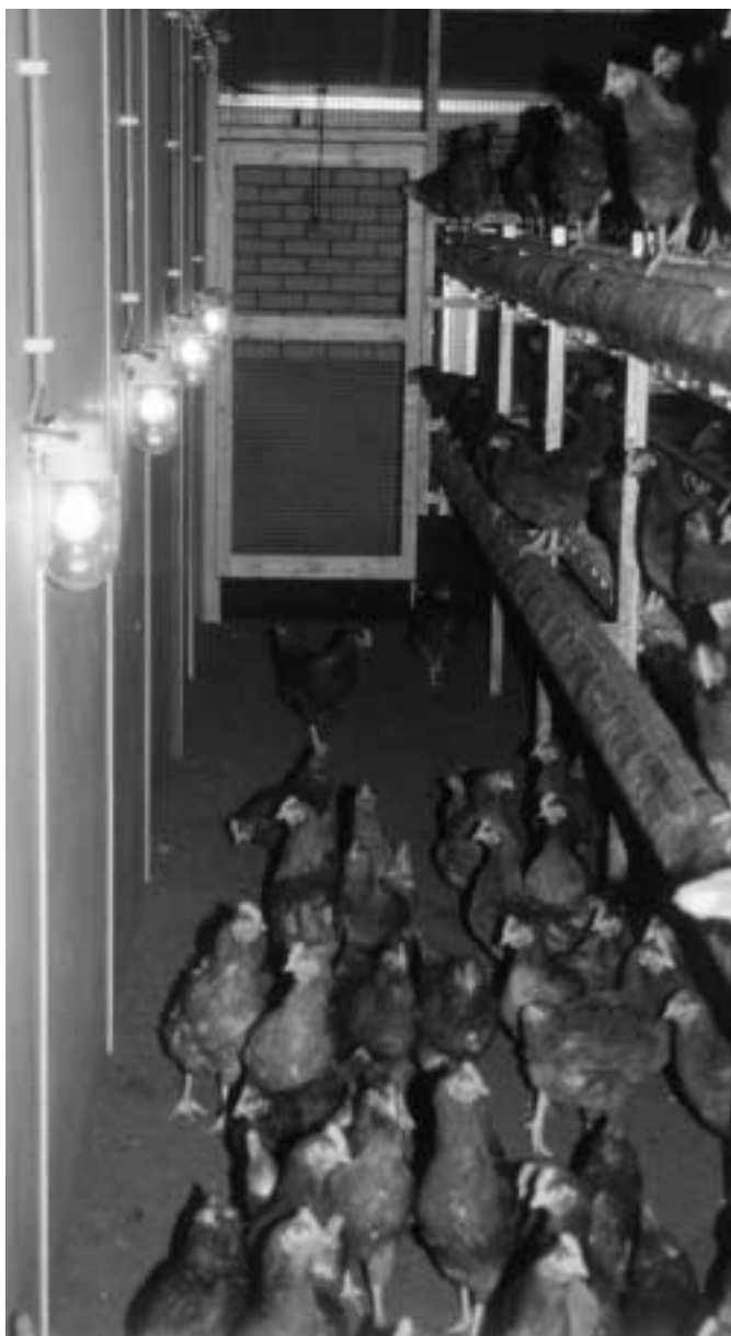
Goede lichtverdeling bij gloeilampen.

Om de invloed van de verlichting te onderzoeken zijn de beide voliëresystemen uitgerust met twee verschillende verlichtingsbronnen. Er is gekozen voor twee totaal verschillende verlichtingssystemen. Het ene type verlichting bestaat uit standaard gloeilampen die aan de plafonds en zijwanden zijn gehangen. Voor een goede verlichting in het systeem, is tussen de etages slangverlichting aangebracht (ook een vorm van gloeilamp). Het andere type verlichting bestaat uit verticaal geplaatste HF-TL lampen (ED58 en ED 2x36 van de firma HATO BV). Door de verticale positie schijnen ze ook tussen de etages en is extra verlichting in het systeem niet nodig. Bij beide verlichtingen is getracht een zo goed mogelijke lichtverdeling te realiseren. Beide verlichtingssystemen zijn zowel bij de Natura-Nova als de Comfort/Compact combinatie toegepast.