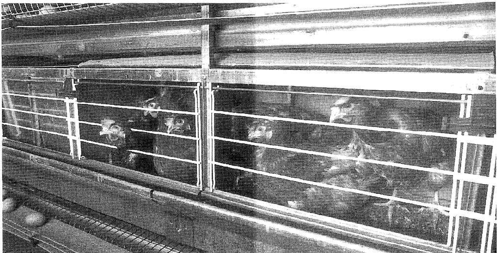
Batterijkooi met legnest, waarbij 2 kooien omgebouwd zijn tot 1 grote kooi. In elke grote kooi + legnest zijn 10 hennen geplaatst.

De conclusie die tot nu toe getrokken kan worden is, dat bij het installeren van een legnest in een batterijkooi nog enkele problemen opgelost dienen te worden met betrekking tot de eikwaliteit. Het lijkt aan te raden behalve een legnest tevens een zitstok in de kooi te installeren, omdat hierdoor het nestbezoek verbetert.