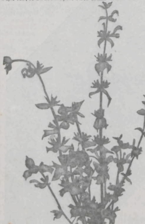
Salvia bracteata , Cliché 3 Mk., Samen: 1 Portion 0,60 Mk., 10 P. 5 Mk., 100 P. 45 Mk. Pflanzen: à 0,75 Mk., 10 Stück 7 Mk., 100 Stück 60 Mk.

Salvia bracteata ist infolge ihrer auffallenden eigenartigen Erscheinung für grosse Gruppen von besonderer Wirkung; die Pflanzen haben im Bau Aehnlichkeit mit Salvia argentea , erreichen eine Höhe von 1,50 Metern und bringen an den reichverzweigten Blütenstengeln ausser den lilauen Blüten sehr schöne, verhältnismässig grosse Bracteen, die ebenfalls herrlich gefärbt sind, so dass die sich an der Pflanze lange haltenden Bracteen auch nachdem die Blüten abgefallen sind, die volle Wirkung einer blühenden Gruppe erzielen. 100 Portionen 45 Mk.