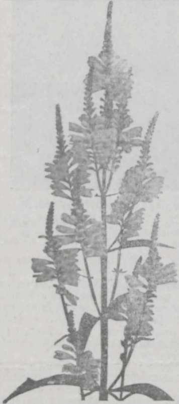
Physostegia virginica compacta rosea , Cliché 3 Mk., Samen: 1 Portion 0,70 Mk., 10 P. 5 Mk., 100 P. 48 Mk. Pflanzen: à 0,60 Mk., 10 Stück 5 Mk., 100 Stück 40 Mk.

Physostegia virginica compacta rosea . Die Staudenerica ist eine der schönsten Herbststauden zum Blumenschnitt und für Gruppen. Von der Stammform zeichnet sich diese Neuheit durch sehr gedrungenen Wuchs, grössere und reichlicher erscheinende Blumen aus. Bei zeitiger Aussaat im Mistbeet kann man schon im 1. Jahre einige Blüten erzielen, zur vollen Entwicklung kommen die Pflanzen jedoch erst im 2. Jahre. 100 Portionen 48 Mk.