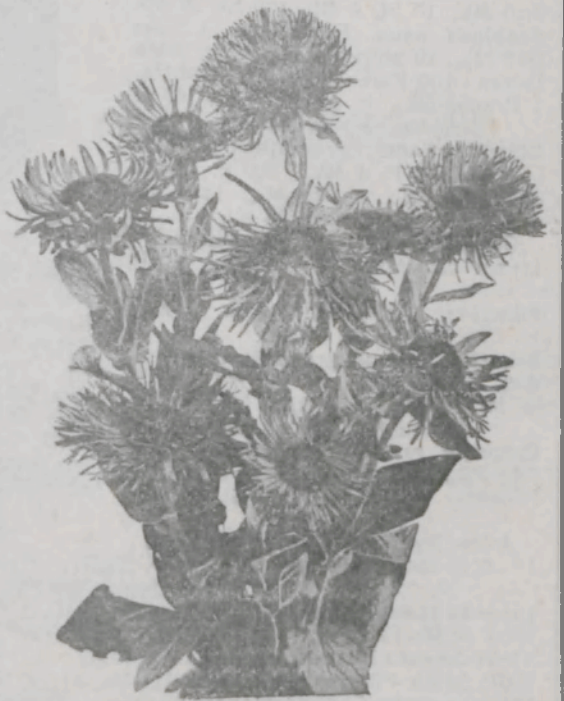
Inula glandulosa „Variabilis“ , Cliché 3 Mk., Samen: 1 Portion 0,50 Mk., 10 P. 4 Mk., 100 P. 30 Mk. Pflanzen à 0,75 Mk., 10 Stück 7 Mk., 100 Stück 60 Mk.

Inulaglandulosa „Variabilis“ (Vorjährige Neuheit.) Diese herrlichen Varietäten stammen von der zierlichen Inula glandulosa laciniata ab; sie bringen die mannigfaltigsten Blütenformen zur Entwicklung, bald sind die Blumenblätter bis zur Hälfte, bald ganz geschlitzt, bald stehen dieselben aufrecht oder nach innen gekrümmt, bald leicht hängend, auch halbgefüllte Formen kommen vor. Die Farbe der Blumen, die einen Durchmesser von 10 cm erreichen, ist hell bis goldgelb. Herrliche Schnitt- und Dekorationsstaude. Mai — Anfang Juli. 100 Portionen 30 Mk.