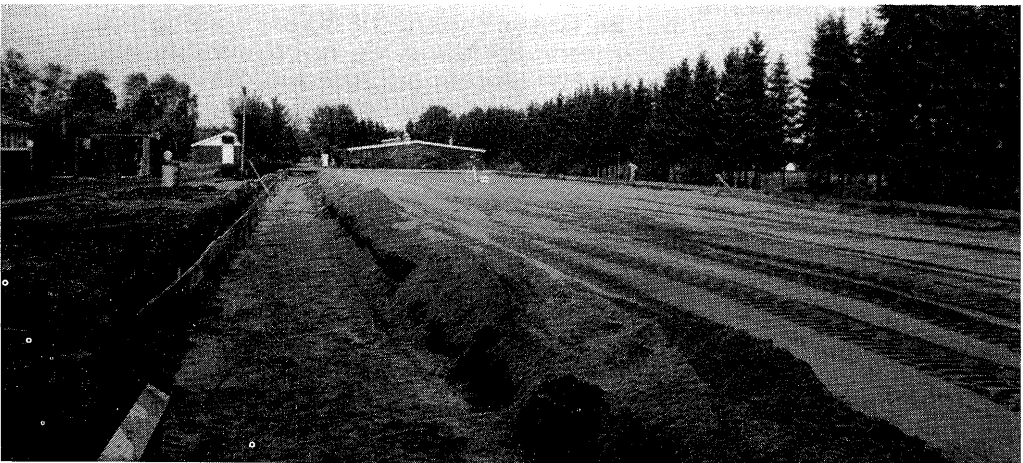
lokatie voor Praktijkonderzoek

Per 1 januari 1989 is gekozen voor een organisatie-structuur waarbij het praktijkonderzoek voor de pluimveehouderij wordt uitgevoerd binnen de afdeling Praktijkonderzoek van het Centrum voor Onderzoek en Voorlichting voor de Pluimveehouderij. Dit betreft dus zowel het praktijkonderzoek dat op de regionale pluimveeteeltproefbedrijven te Delden en Maarheeze, als het praktijkonderzoek dat op "Het Spelderholt" wordt uitgevoerd.