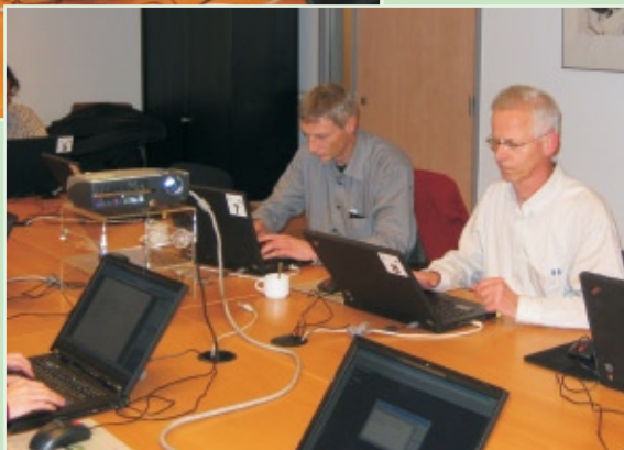
Deelnemers van een Group Decision Room sessie in actie.