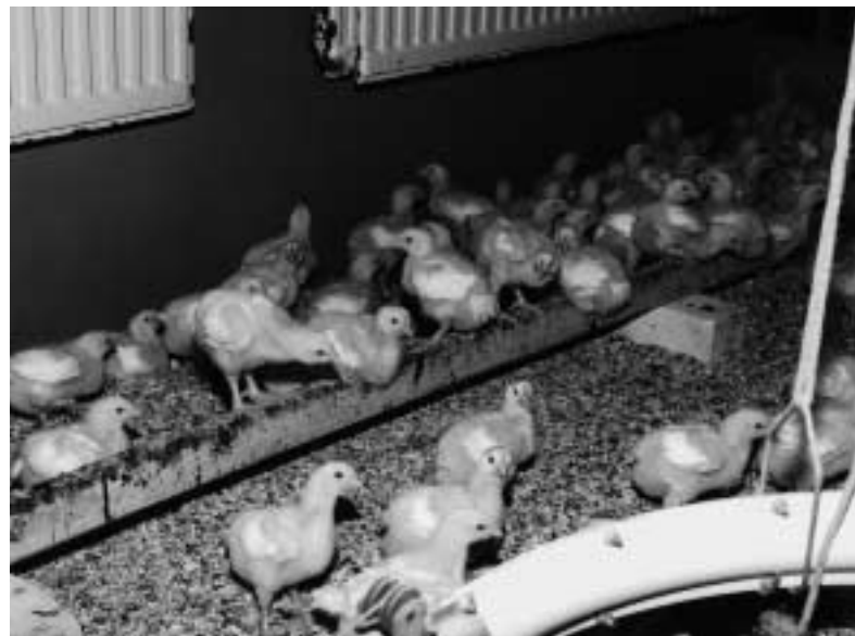
Kuikens op zitstok.

door andere soorten kuikens en kan een antwoord gegeven worden op de vraag of het gebruik van zitstokken beïnvloed wordt door het type kuiken. Naast het bepalen van het zitstokgebruik zijn ook metingen verricht om de schrikachtigheid van de dieren te testen. Dit werd gedaan om een indruk te krijgen van de gevoeligheid van de dieren voor de manier waarop men met hen omgaat. Door de ongekeerde hoge buitentemperatuur in de periode van 52-56 dagen leeftijd is de geplande bepaling van de 'gait score' niet doorgegaan. Deze gait-score is een maat voor de manier van lopen. Lopen de kuikens vlot en gemakkelijk of hebben ze moeite met lopen en staan?