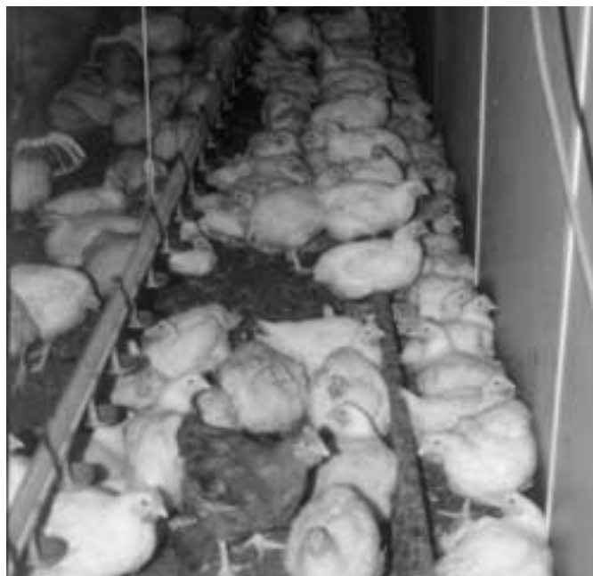
Zitstokgebruik bij vleeskuikens