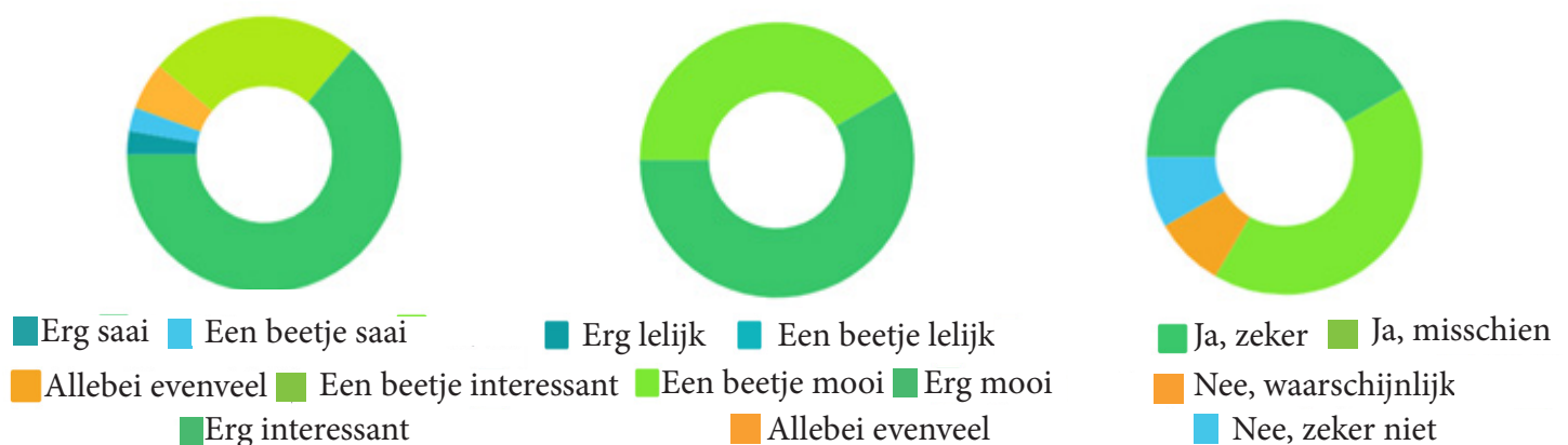
Figuur 4: Kinderen over de Natuurontdekker

Bijna alle kinderen zijn positief over de Natuurontdekker. De meeste kinderen vinden de Natuurontdekker erg interessant en erg mooi. Ook zou 42% van de kinderen zeker nog een keer met de Natuurontdekker willen spelen.