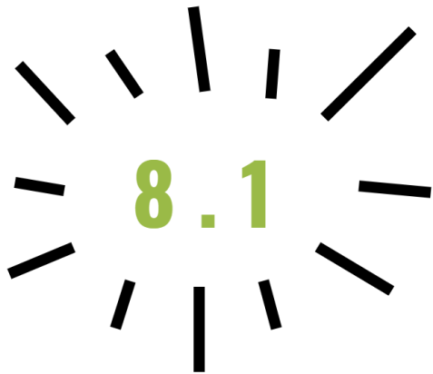
Figuur 5: Gemiddelde score die de kinderen de Natuurontdekker geven.