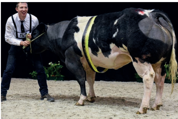
Louisiana van Terbeck (v. Hazard), kampioene oudere vaarzen