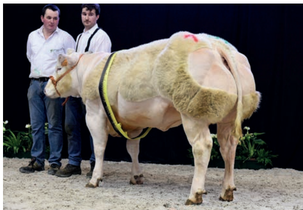
Musical van de Kerkenhofstede (v. Ultimo), kampioene jonge vaarzen

De jongste vaars in het kampioenschap was Mila van de