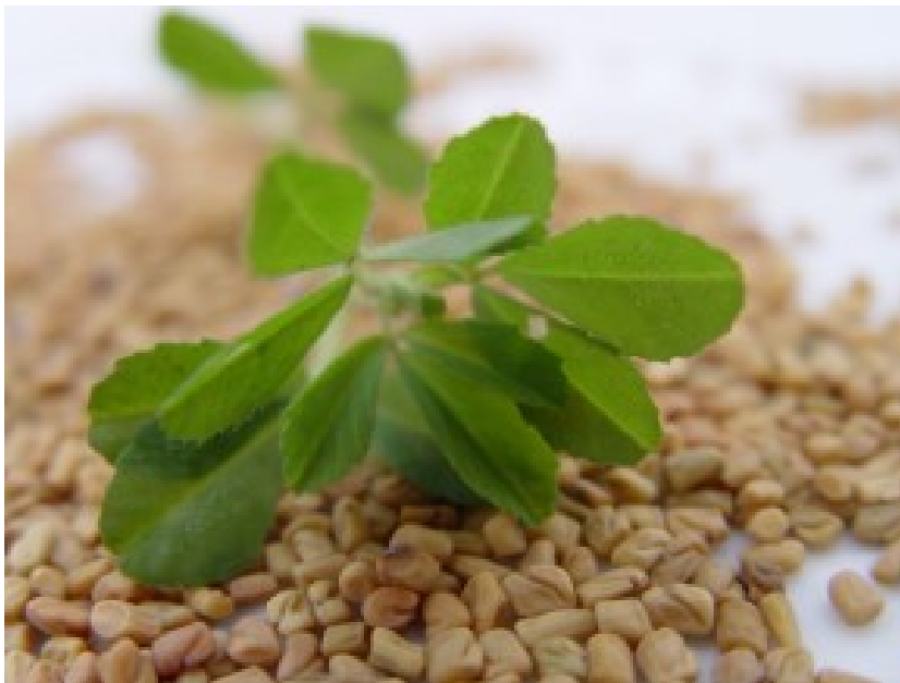
Fenegriek ( Trigonella foenum-graecum , Grieks hooizaad)

Naast deze min of meer bekende infectieuze veroorzakers van diarree is er nog een derde oorzaak: ellende. Als een dier zich erg beroerd voelt bv. door een onderliggende longontsteking kan het ook diarree vertonen. Dit laatste wordt vaak aangegeven als het pneumo-enteritis-complex.