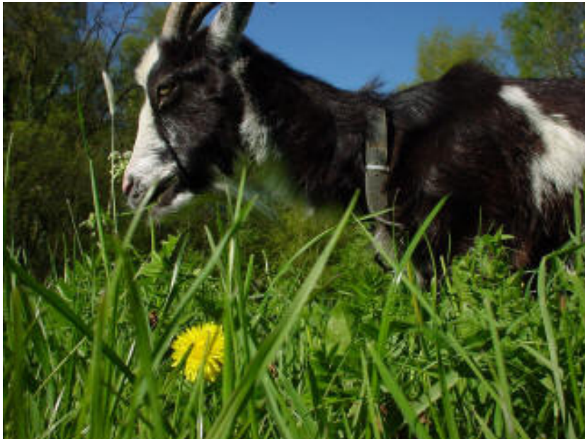
In een kruidenrijke weide heeft een geit wat te kiezen