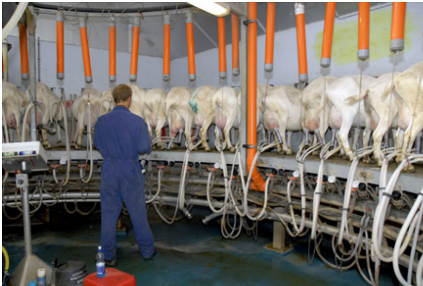
Geiten in de melkstal (WUR9600_NL_geiten_melken.jpg)