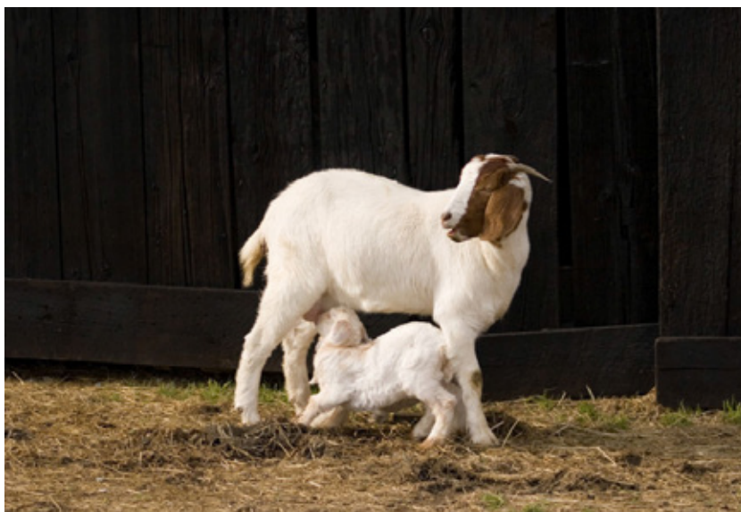
Geit met jong (webimage-D257A80F-921E-4661-AF4D0FD03F4C5994.jpg)

Melkverstrekking met een speen stimuleert de zuigreflex en de slokdarmsleufreflex. De slokdarmsleuf zorgt dat de melk niet in de pens stroomt maar in de lebmaag. Onvoldoende slokdarmsleuf reflex komt door: overvoeren, te snelle melkopname (hongerige lammeren), niet juiste temperatuur, niet-taaie speen of te lage concentratie van de melk. Wanneer melk in de pens komt kan deze gaan rotten, dit wordt pensdrinken/kleischijten genoemd. Voedingsdiarree kan ook juist als de melk niet in de pens komt, maar er teveel voedingsstoffen ineens in de darm komen zoals bij teveel ineens drinken of te hoge concentratie melkpoeder.