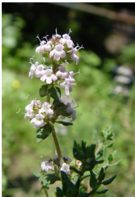
Tijm ( Thymus vulgaris / zygis )