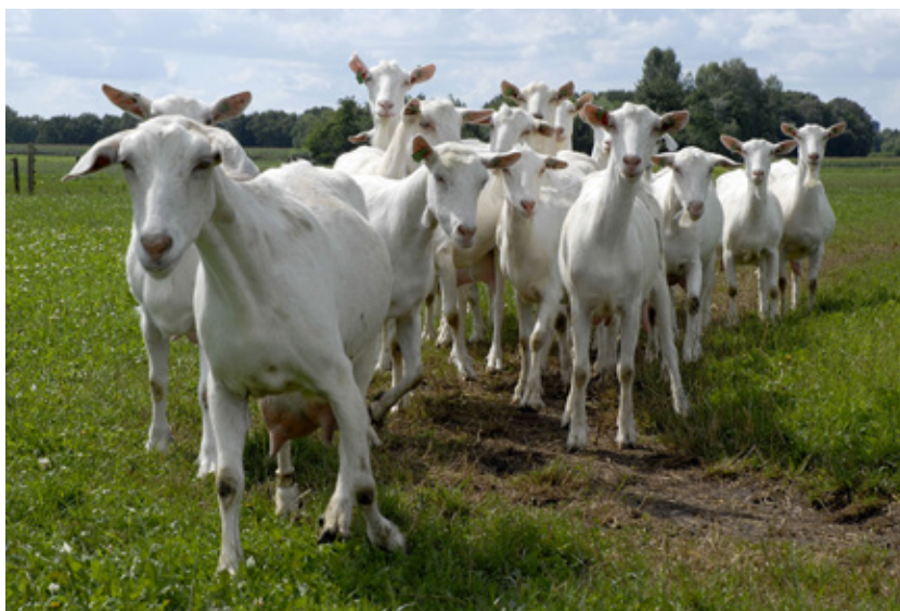
Geiten die buiten lopen moeten beschermd worden tegen wormbelasting (WUR9469_NLgeiten_weiland.jpg)

Er zijn diverse uitgaves over wormbeheersing bij biologische geiten: http://edepot.wur.nl/115690