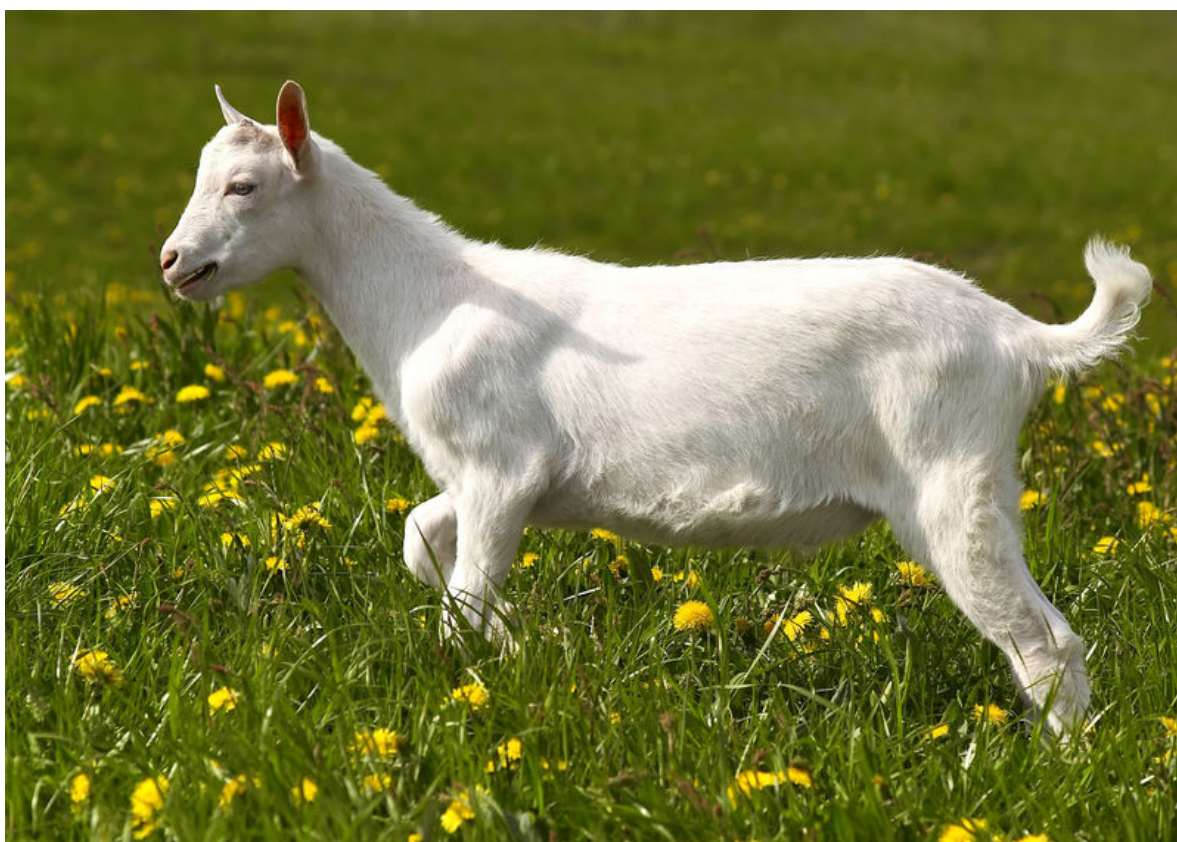
Geit in de kruidenwei (webimage-AE4810DB-BA45-4FCA-B0EA2D6BF598DC4E.jpg)

Op dit moment is er ook vraag naar middelen en methoden om het antibiotica gebruik te reduceren, en inzicht in toepassing van natuurlijke middelen in de melkgeitenhouderij. Het streven om het gebruik van antibiotica terug te dringen vraagt om een ander management. Goede voeding, huisvesting en hygiëne zijn hierbij belangrijk. In dit boekje worden handvaten gegeven om met natuurlijke middelen de gezondheid en de weerstand van de dieren te bevorderen en zo ziektes te voorkomen. Tevens kunnen middelen worden ingezet om de ernst van de ziekte te reduceren. Doel is tevens om de dierenartsen te informeren over de mogelijkheden van natuurproducten en de wetenschappelijke onderbouwing hiervan inzichtelijk te maken.