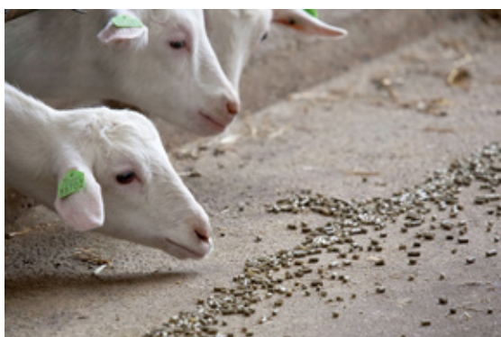
Lammeren aan het krachtvoer (BIOKENNIS_GEITSCHAAP_NL_0114MMZS_2011-8676.jpg)