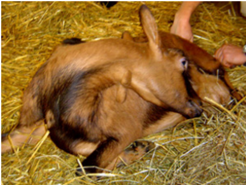
Geit met slepende melkziekte