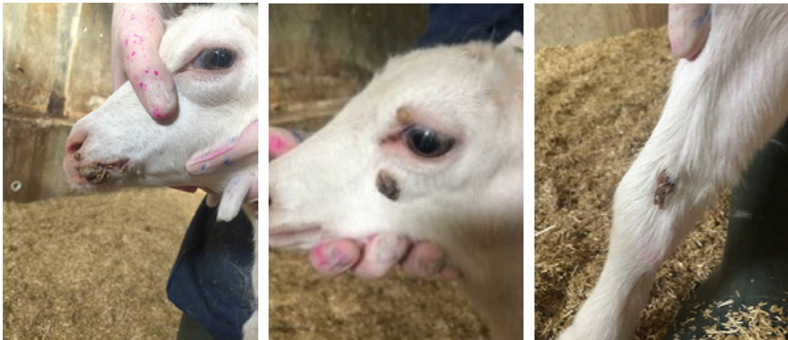
Ecthyma aan de bek, kop en poten

N.B. Ecthyma is een zoönose, dus gebruik handschoenen bij het hanteren van aangetaste dieren!