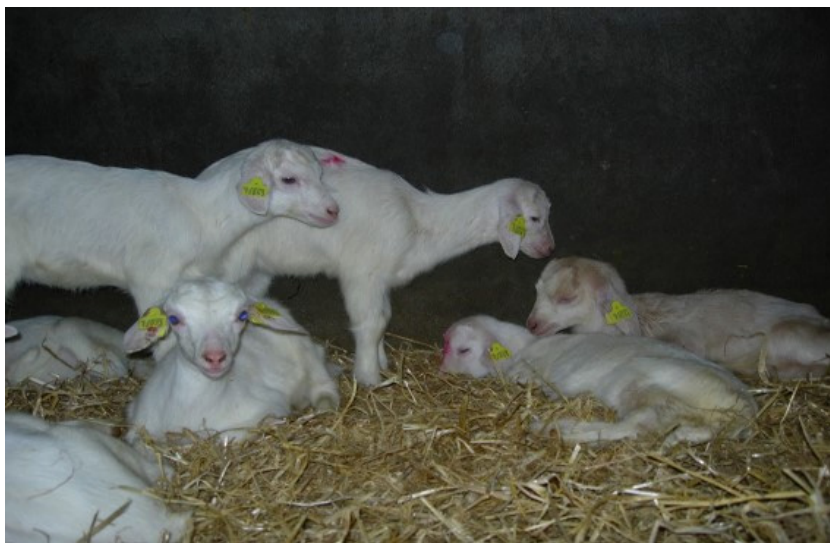
Lammeren met mogelijk longontsteking

Pasteurella, Mannheimia en Bibersteinia zijn bacteriën die snel kunnen aanslaan onder ongunstige omstandigheden. Dieren die een echte longontsteking hebben door één van deze bacteriën zijn vreemd genoeg vaak minder duidelijk ziek: ze willen niet bewegen, hoesten vaak nauwelijks, hebben lang niet altijd een snotneus en vaak ook diarree. Als de lammeren dit stadium hebben bereikt is ingrijpen met antibiotica noodzakelijk en kunnen natuurproducten alleen niet genoeg soelaas bieden.