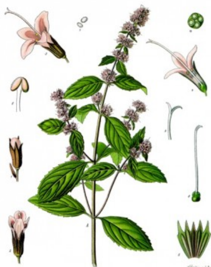
Mentha piperita L. Image processed by Thomas Schoepke www.plant-pictures.de