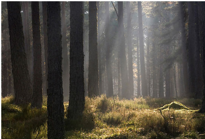
Naaldbomen, bron van hars