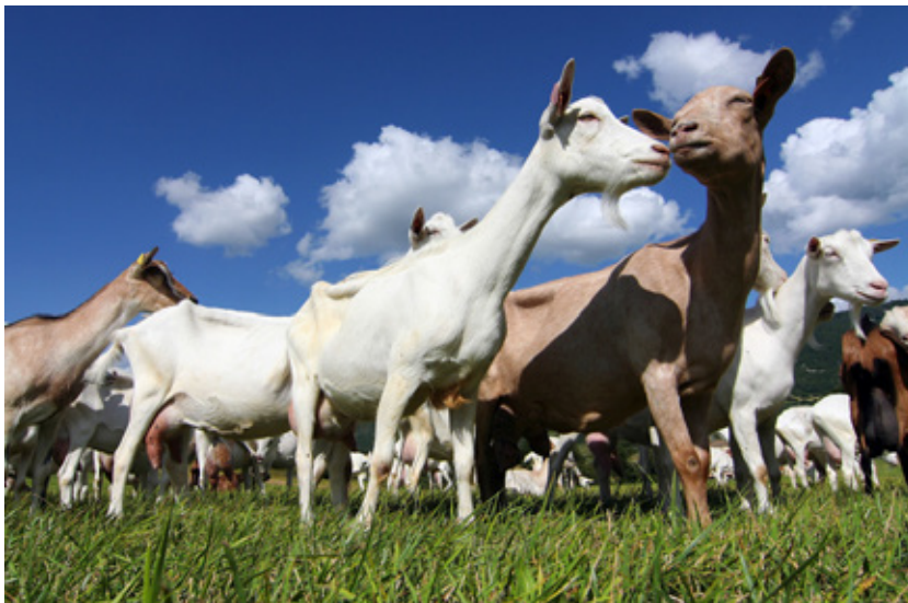
Geiten in de wei

Inmiddels is er door twee achtereenvolgende Europese onderzoeksconsortia onderzoek naar gedaan. Deze plant is niet alleen prachtig om te zien (de piramidevormige roze bloeiwijze in het grasland doet aan orchideeën denken), maar heeft ook zeer veel gunstige eigenschappen. Ze legt zoals de meeste klavers stikstof uit de lucht vast, en kan door haar diepe penwortel langdurige droogteperiodes overleven. Ze heeft een lang bloeiseizoen en is heel goed voor bijen en andere insecten. Als voedergewas heeft esparcette een zeer hoge antioxidantwaarde, waarmee ze met kop en schouders boven andere gewassen uitsteekt, ook boven vergelijkbare gewassen zoals Medicago sativa (luzerne) of andere klaversoorten. Ze levert eiwitten en vermindert het risico op trommelzucht (overmatige gasvorming). De urine van de dieren bevat minder stikstof en er ontstaat minder methaangas.