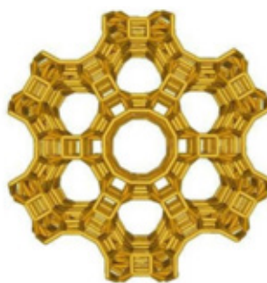
Structuur zeoliet, werkt als een zeef