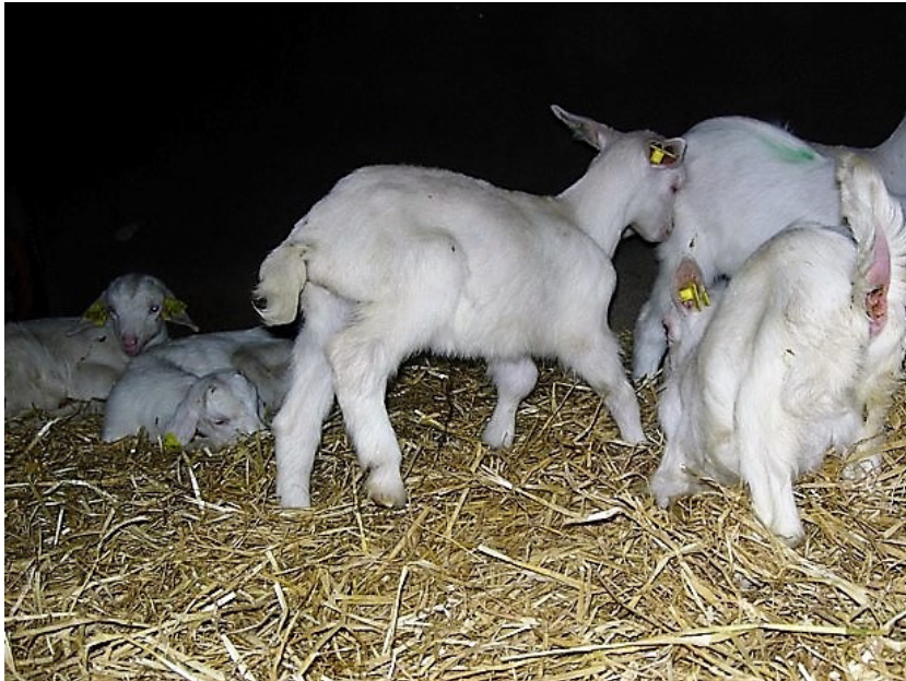
Geitje met gewrichtsontsteking