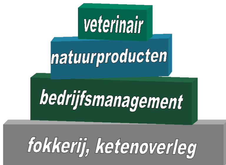
Figuur 1 De aanpak van diergezondheid