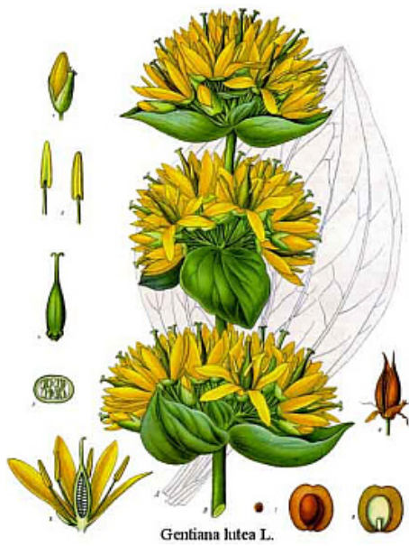
Gentiaan, een plant met bitterstoffen