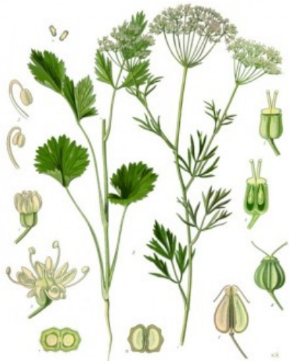
Anijs ( Pimpinella anisum )