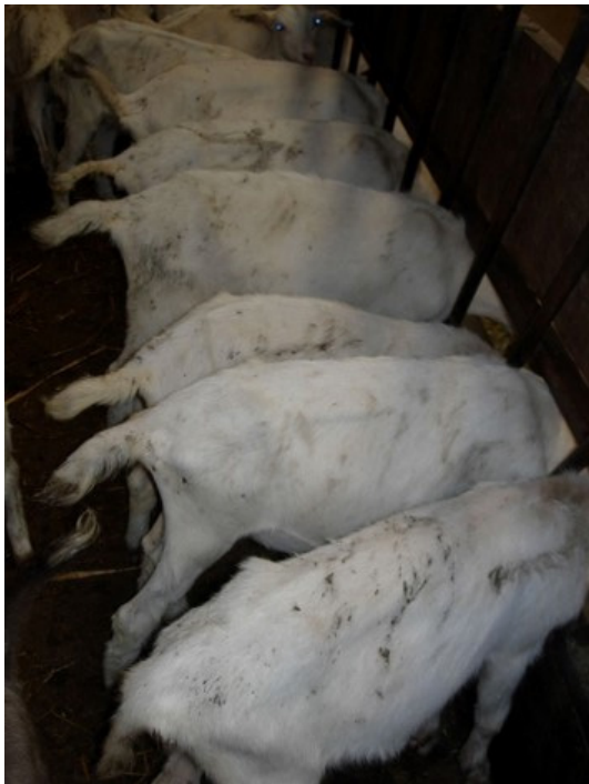
Besmeurde lammeren