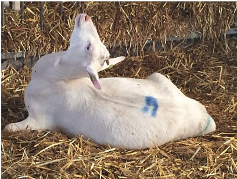
Geit met hersenverschijnselen