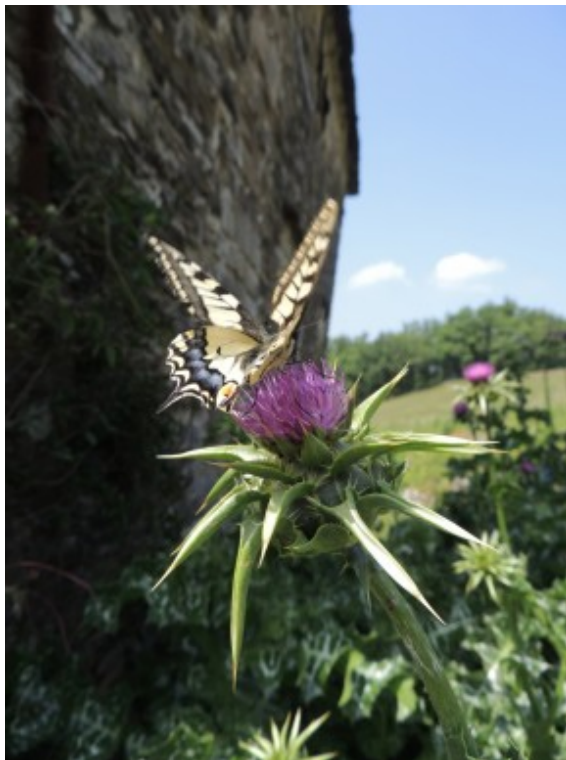
Mariadistel beschermt de lever