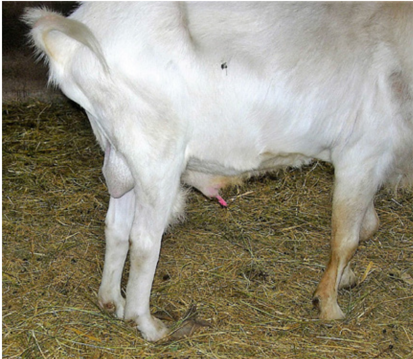
Slecht onderhouden klauwen