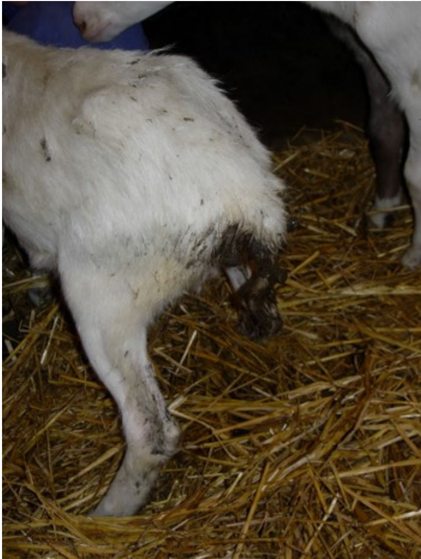
Lam met diarree door coccidiose

Dit is een andere darmaandoening veroorzaakt door de eencellige parasiet Eimeria , bij geiten is de beruchtste E. Ninakholyomikovae . Dieren worden besmet door de opname van oöcysten via de bek, waarna de parasiet zich vermenigvuldigt in de dikke darm. Hierdoor kan de darmwand beschadigd raken en wordt de darmfunctie verstoord. Na vermenigvuldiging in de darm, wat normaal gesproken 2-3 weken duurt, worden via de mest grote hoeveelheden nieuwe oöcysten in de omgeving verspreid, waarna ze door andere dieren kunnen worden opgenomen en de cyclus opnieuw wordt doorlopen. Verontreiniging van voer en water met geïnfecteerde mest is dus een belangrijke risicofactor voor de verspreiding van coccidiose. Oöcysten zijn zeer resistent tegen schoonmaakmiddelen en droogte en kunnen jaren overleven in de omgeving.