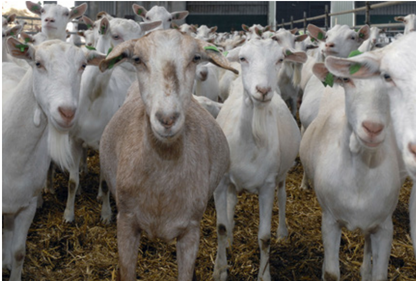
Geiten in de pot (WUR9489_NL_geiten_stal.jpg)

Voor en na aflammen is het verstrekken van voldoende en vooral glucogene energie in het rantsoen belangrijk voor het voorkomen van leververvetting en slepende melkziekte aan het einde van de dracht en een goede start van de lactatie. Geiten in een goede conditie blijven gezonder en actiever en starten beter op. Voldoende beweging is belangrijk voor een goede voeropname en stofwisseling. Tevens wordt bij bewegen de afvoer van afvalstoffen, ontstaan als gevolg van slepende melkziekte, bevordert (en zo de lever ontlast) door "opmaken" daarvan door de spieren.