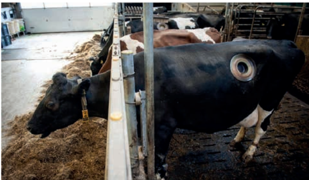
Met behulp van een opening (fistel) kan de pensinhoud van een koe worden onderzocht

een heldere visie op de verhouding tussen dierenwelzijn en andere duurzaamheidsdoelen in de veehouderij door de discussie over zo'n integrale visie te faciliteren in diersectoren waar de ontwikkeling al is begonnen, en te initiëren waar nodig. Zo'n visie kan de basis vormen voor een document dat de CCD meer houvast biedt in de afweging.