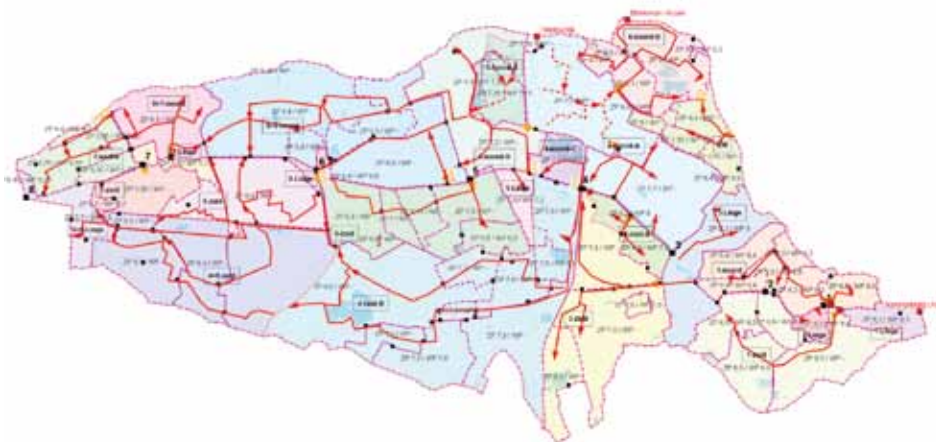
Figuur 2: Analyse van het watersysteem van de Overbetuwe bij wateraanvoer