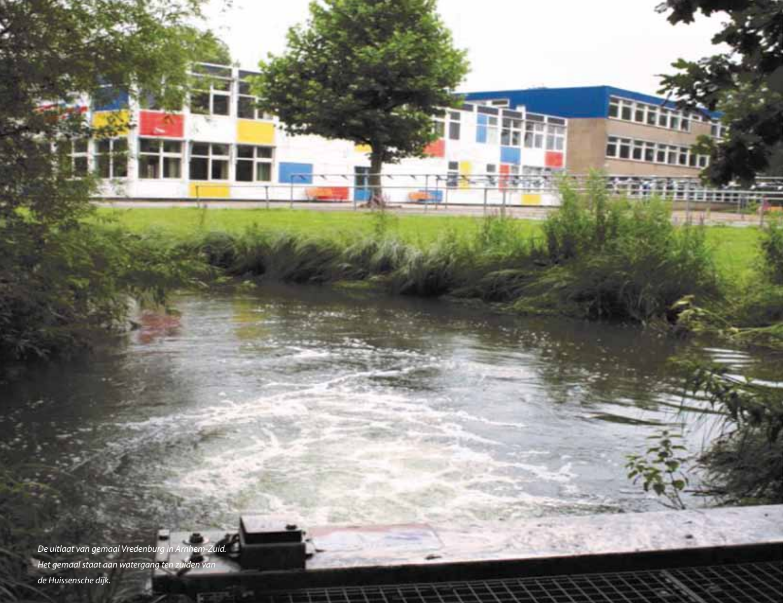
De uitlaat van gemaal Vredenburg in Arnhem-Zuid. Het gemaal staat aan watergang ten zuiden van de Huissensche dijk.