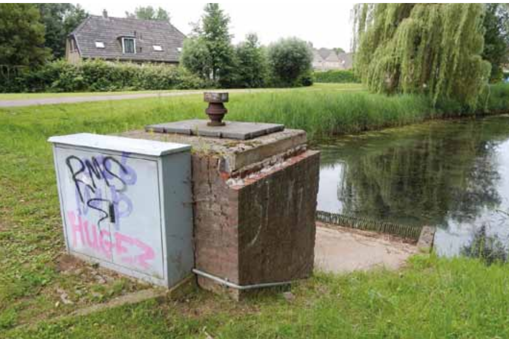
Figuur 4: Aanvoergemaal Vredenburg in Arnhem-Zuid

dat de Kop van de Betuwe volgens verschillende patronen onder water komt te staan (ook wel inundatie genoemd), in de gesimuleerde situatie dat er een bres mocht optreden. De op hoogte gelegen snelwegen van noord naar zuid (A325 en A50) zorgen voor opdeling van het gebied in duidelijk afgescheiden deelgebieden. Daarachter kan het inundatiewater blijven staan.