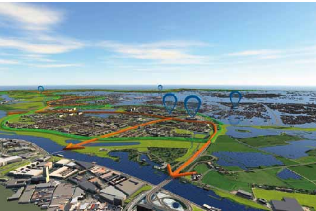
Figuur 5: Evacuatie-hub met op de voorgrond de robuuste gebouwen gemarkeerd