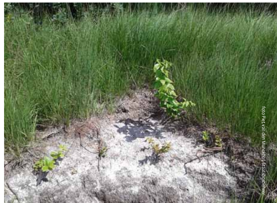
Afbeelding 4. Beeld van uitlopers na verwijderen trosbosbesstruik.