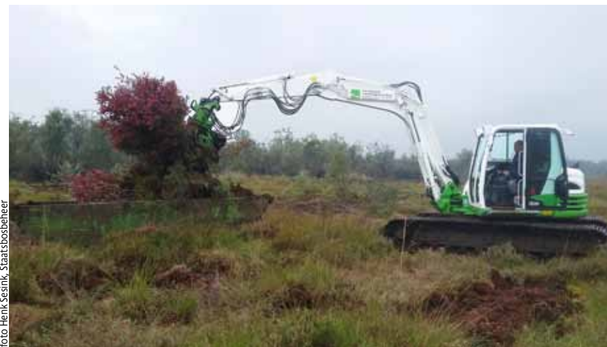
Afbeelding 2. Uittrekken van de trosbosbes met een rupskraan met sorteerknijper.

Uit de monitoring blijkt dat het goed is gelukt om de wortels met een diameter groter of gelijk aan 15 mm te verwijderen. In de metingen kort na de bestrijdingswerkzaamheden zijn slechts twee wortelstokken gevonden die net boven deze grens uitkwamen (respectievelijk 15,2 en 15,4 mm dik). De gemiddelde worteldiameter was 4,5 mm. In de plots zijn geen achtergebleven bessen aangetroffen. Het aantal kiemplanten was verwaarloosbaar: in alle plots samen stonden drie kiemplanten. Uit de monitoring blijkt dat de bedekking van de trosbosbes een groeiseizoen na de bestrijding in alle percelen lager dan vijf procent is. Tabel 1 toont een overzicht van de onderzoeksresultaten. Het gemiddelde aantal zaailingen na een groeiseizoen is zeer klein en varieert van 0 tot 1 per m 2 . Het gemiddelde aantal worteluitlopers varieert van 1 tot 6 per m 2 . Naast het aantal worteluitlopers per plot is ook gekeken naar het aantal scheuten (uitlopers) dat een wortel produceert. Een achtergebleven levende wortel heeft gemiddeld drie uitlopers. De worteluitlopers worden gevormd uit scheuten die gemiddeld 3,8 mm dik zijn. De dunste aangetroffen scheut die nog worteluitlopers vormde was 1,3 mm dik. Er zijn geen significante verschillen gevonden in het aantal uitlopers en de afmetingen van de uitlopers tussen de boslocaties en locaties in open terrein. Ook tussen de aannemers (rupskranen) zijn geen significante verschillen gevonden.