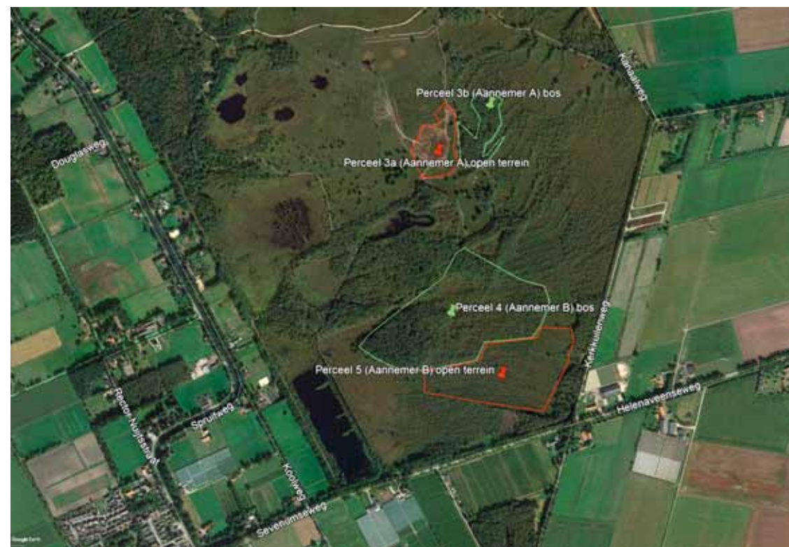
Afbeelding 3. Overzicht van de monitoringslocaties.