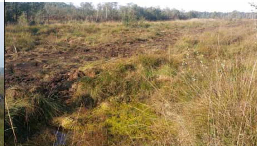
Afbeelding 5. Veenput met hoogveen na verwijderen trosbosbesstruik.