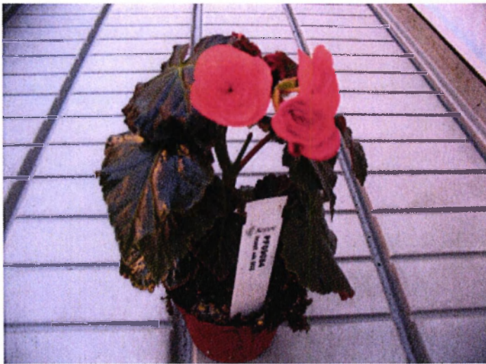
Afb. 2 Glimmend blad, aangetroffen op 26 januari 2009

Gedurende de proefperiode is de toets tweemaal door opdrachtgever bezocht. De toets is uitgevoerd in de periode van week 2-2009 t/m week 8-2009.