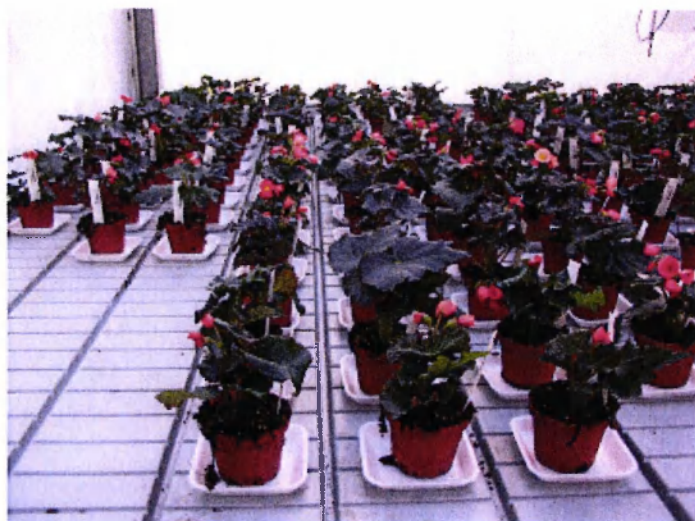
Afb. 1 Overzichtsfoto kasproef