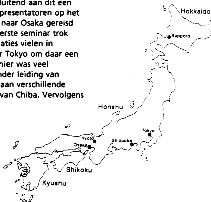
Fig 1: Kaart van Japan