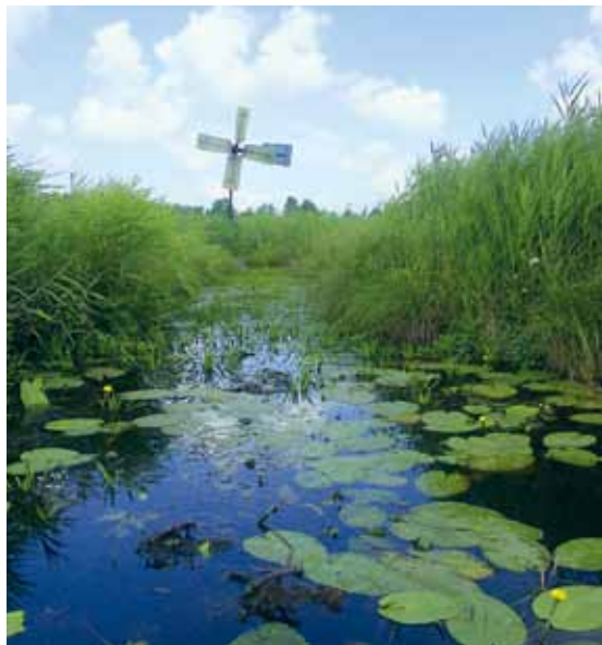
verlandend petgat in de Weerribben.