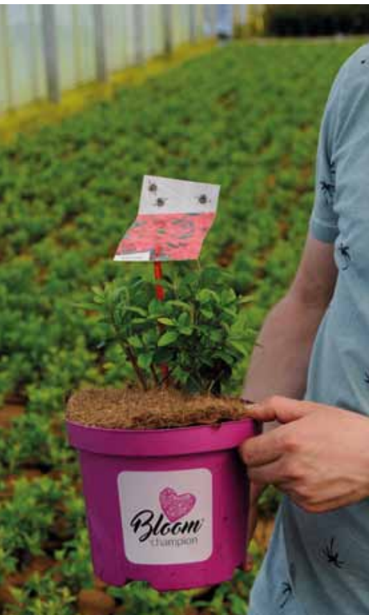
Met dit concept, een doorbloeiende Azalea, wil Braspenning dit najaar op de markt komen.

Azalea in een zeer breed sortiment van ongeveer 200 cultivars. Braspenning: 'Dat brede sortiment is weleens lastig, maar we hebben het nodig om onderscheidend te blijven. Er zijn natuurlijk meer kwekers die Rhododendron en Azalea kweken, maar er zijn eigenlijk geen kwekers die dit brede sortiment aanbieden. Als ik mijn sortiment beperk tot de echte hardlopers, word ik net als de rest. En dat wil ik niet. Ik heb dat onderscheidende brede sortiment nodig om in de picture te blijven bij de grote Duitse tuincentra als Dehner, die het belangrijk vinden om een breed sortiment aan te bieden.'