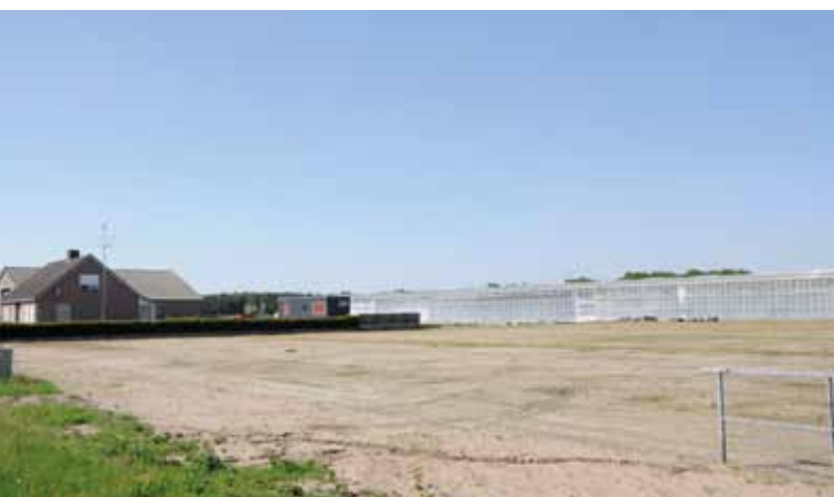
Hier komen de nieuwe loods en het kantoor.

3 belangrijkste gewassen/soorten: Rhododendron, Azalea, Heesters